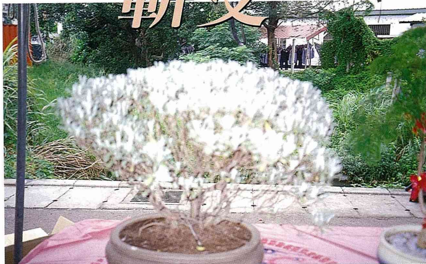
■葉片銀白色的芙蓉，是兼具觀賞價值的藥用植物。

芙蓉可用種子繁殖，把成熟的種子用穴盤育苗，長到5~6公分再行定植到畦上或用盆栽亦可。芙蓉生長很遲緩，培養到莖粗2公分以上大約需2~3年，如果直接種在田間生長較速，愈多年生莖愈粗大者愈值錢。