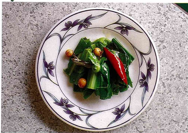
■山翅菜多半以這種「清秀佳人」的烹調面貌，保持它的口感。

至於山蘇，大概是一般人都很能接受的蕨類，後來幾次在餐廳點菜，同桌的人都吃的盤底朝天，不知是好奇還是真的好吃。一般料理山蘇以快炒最普遍，以保持它的清脆，也有燙熟用冰水急冷，沾沙拉醬，但不如淋麻辣醬汁過癮。