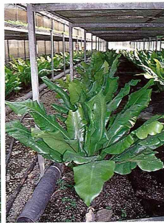
■腦筋快的花農也利用床架下方，栽培山蘇，一方面收嫩芽當山菜，一面收老葉當切菜。