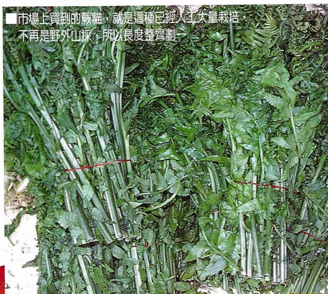
■市場上買到的蕨貓，就是這種已經大量栽培，不再是野外採，所以長度整齊劃一

日本人也愛吃一種全紫紅色的蕨芽，燙熟放在烏龍麵湯中或沾沙拉醬吃。大部分的蕨都吃起來滑滑粘粘，故吾兒戲稱之為「刷牙菜」，是吃一次打死都不再吃，枉費媽媽的愛心。不過山蘇倒