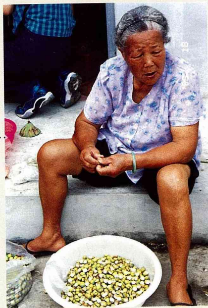
■ 辛苦剝蓮子的阿媽。

眼前一大哇、一大哇的蓮田，在藍天碧野下，以茁然挺立的姿態蔓延開來，面積之大，固然令人歎為觀止；在我們下車駐足觀賞後，更驚覺於碧綠清新的荷葉下，竟是泥濘混濁的田土，它是如此地出污泥而不染，難怪蓮花被譽為「花中君子」。正出神地凝望娉婷蓮花的當兒，忽見田