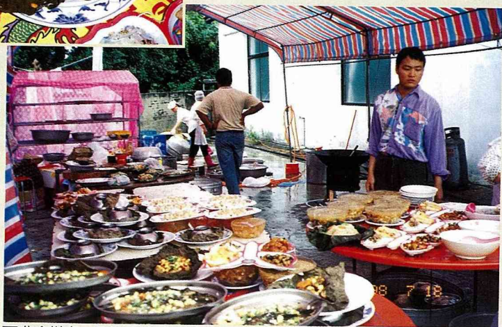
■農會辦桌，提供「蓮子美食大餐」。