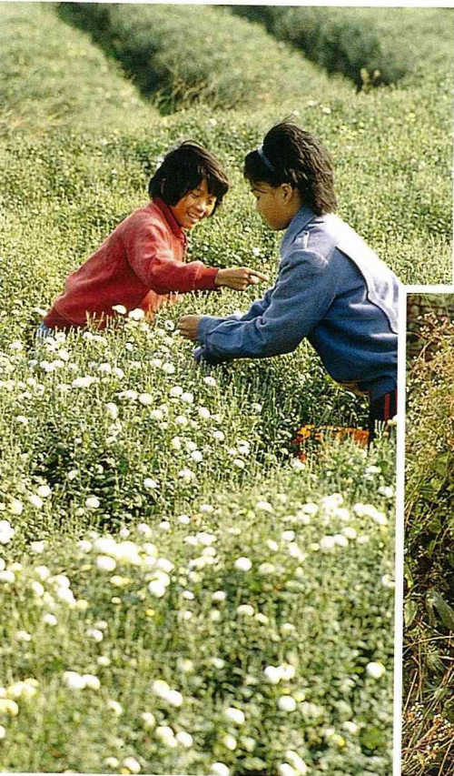
■美麗的杭菊，是民間常用的藥草植物。