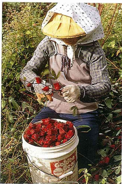
■洛神花的滋味，採自鮮紅萼片。