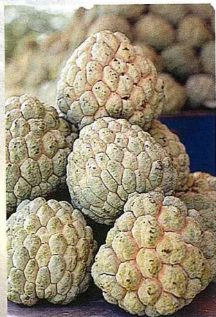
■太麻里釋迦，又香又甜。

太麻里鄉的產業結構仍以農業為主，工商業其次。農產品有稻米、雜糧、釋迦、金針、茶葉、枇杷、柑桔等，其中以釋迦、金針、茶葉、枇杷、菠蘿蜜、杭菊等，最為著名。