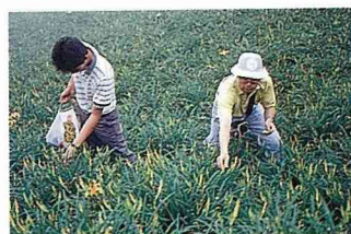
■金針產業轉型經營，提供遊客體驗採金針的樂趣。

居至台東的人很多，當時，來自嘉義梅山地區的移民集中在金針山落腳，並從梅山帶來金針苗在此種植，由於海拔高、溫度低、濕度大，非常適合金針生長，質嫩味香，產量之豐，曾執全省牛耳，給太麻里鄉民帶來了不少財富，惟好景不常，金針市場自民國75年受創後，已大不如前，每下愈況，部份針農為突破困境，毅然轉作，金針種植面積因此大減。