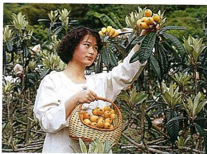
■早生枇杷，價格看俏。

金針農為突破經營困境，很多轉作高經濟價值之高山茶，來自金針山的高山茶，由於地質、氣候關係，加上製茶技術不斷改進，茶香味甘，喉韻絕佳，堪稱茶中極品，上市後甚獲消費者讚賞，於84年4月15日特請前內政部長吳伯雄先生前來品嚐，並命名為「太峰高山茶」。