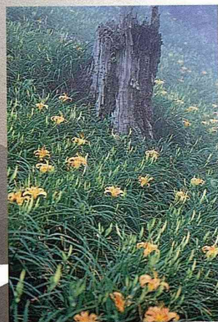
■盛開的金針花，美得可以入畫。