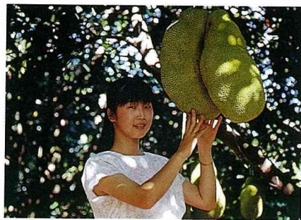
■菠蘿蜜有異國風情。