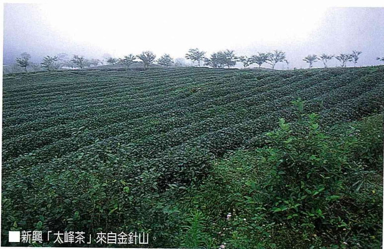
■新興「太峰茶」來自金針山