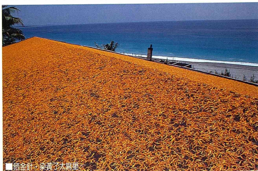
■晒金針，染黃了太麻里。