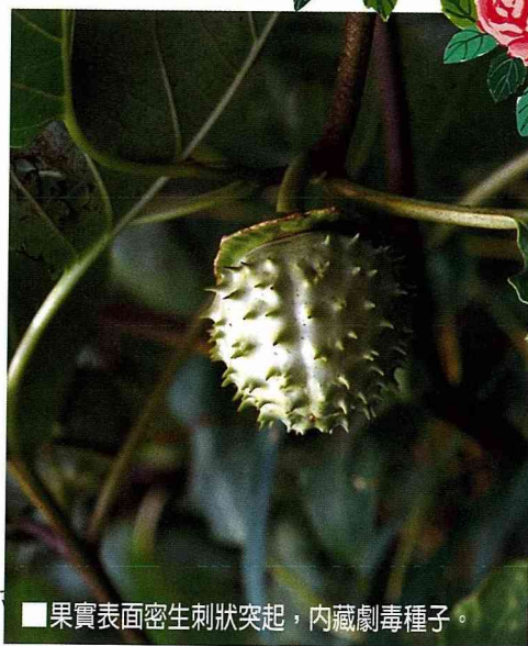
■果實表面密生刺狀突起，內藏劇毒種子。