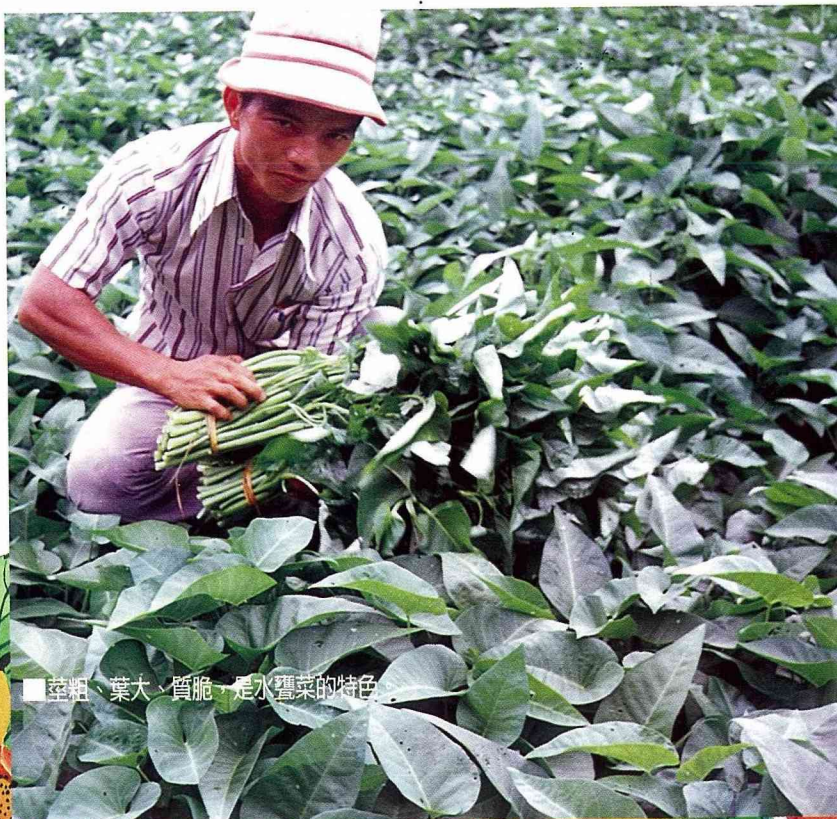
■莖粗、葉大、質脆，是水蕹菜的特色

旋 花科水蕹菜屬二年生水性草本植物，長於地下水噴出的水田中，葉片寬大，莖中空有節且肥胖，開白色花大朵酷似牽牛花，結果莢裡有種子4粒，成熟