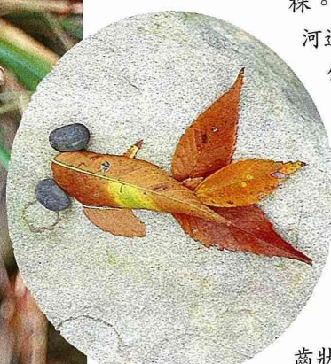
■幾片榆樹葉，加上兩粒小石頭，像不像是一隻大眼泡金魚。