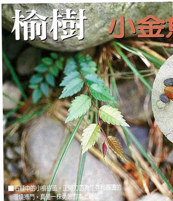
■石縫中的小榆樹苗，正努力的為生存和周遭的環境搏鬥，真是一株勇敢的本土樹苗。