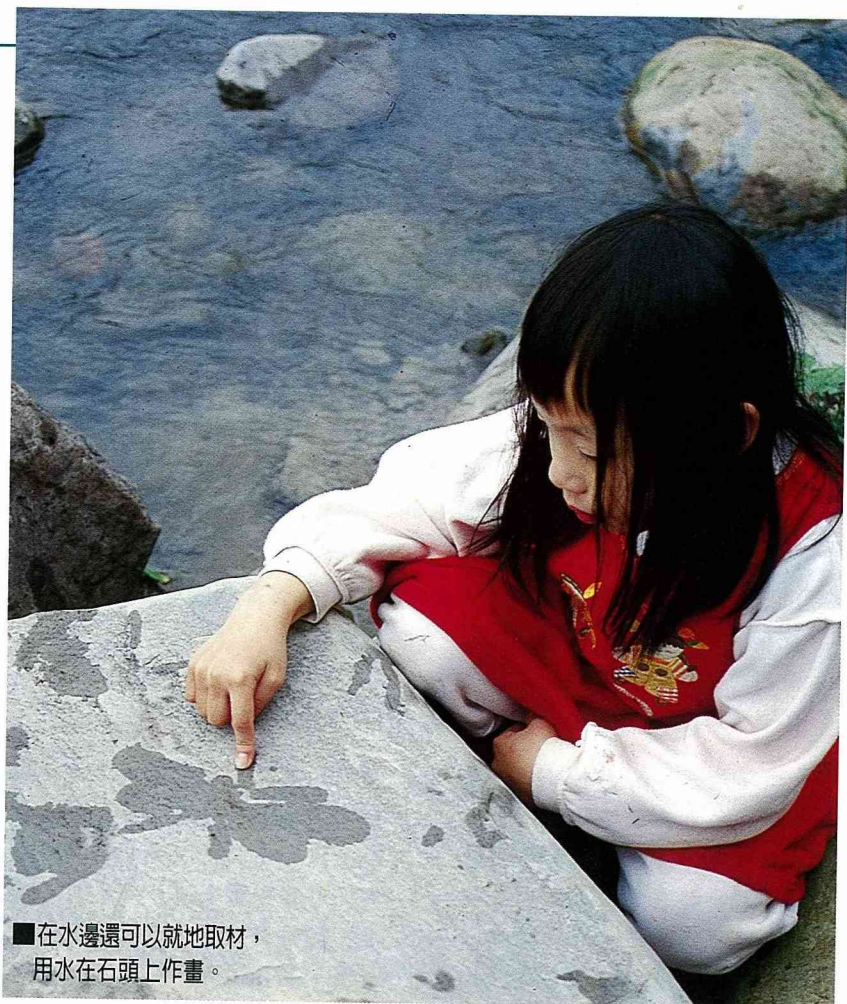
■在水邊還可以就地取材，用水在石頭上作畫。

另外，在水邊最多的就是大石頭，女兒就用水在石頭上作畫，替她的小金魚找些朋友，畫上水族背景，於是一個輕鬆、自然、愉快的假日下午，誰說一定要在五光十色的都會中渡過呢？