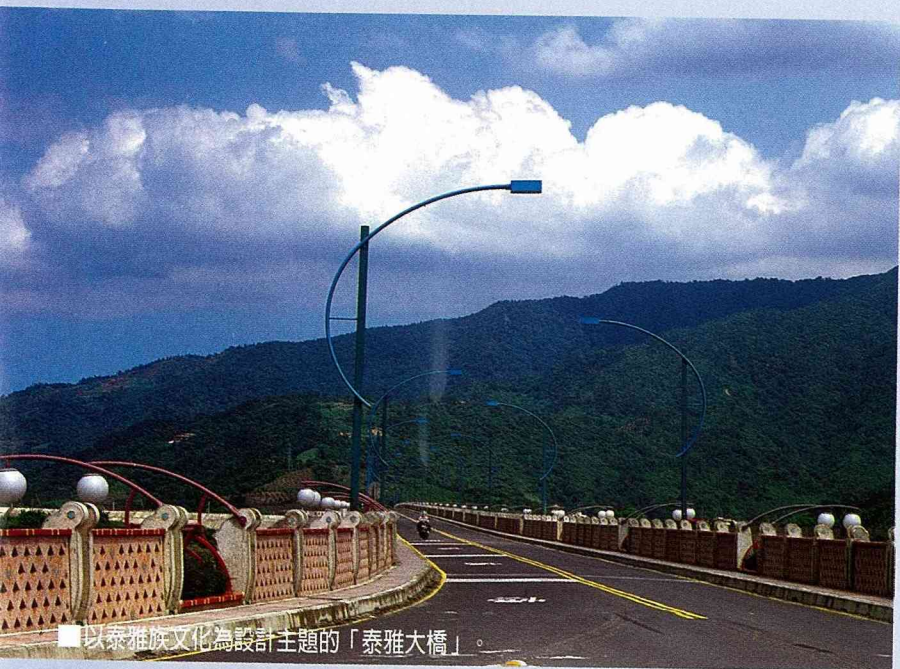
■以泰雅族文化為設計主題的「泰雅大橋」。