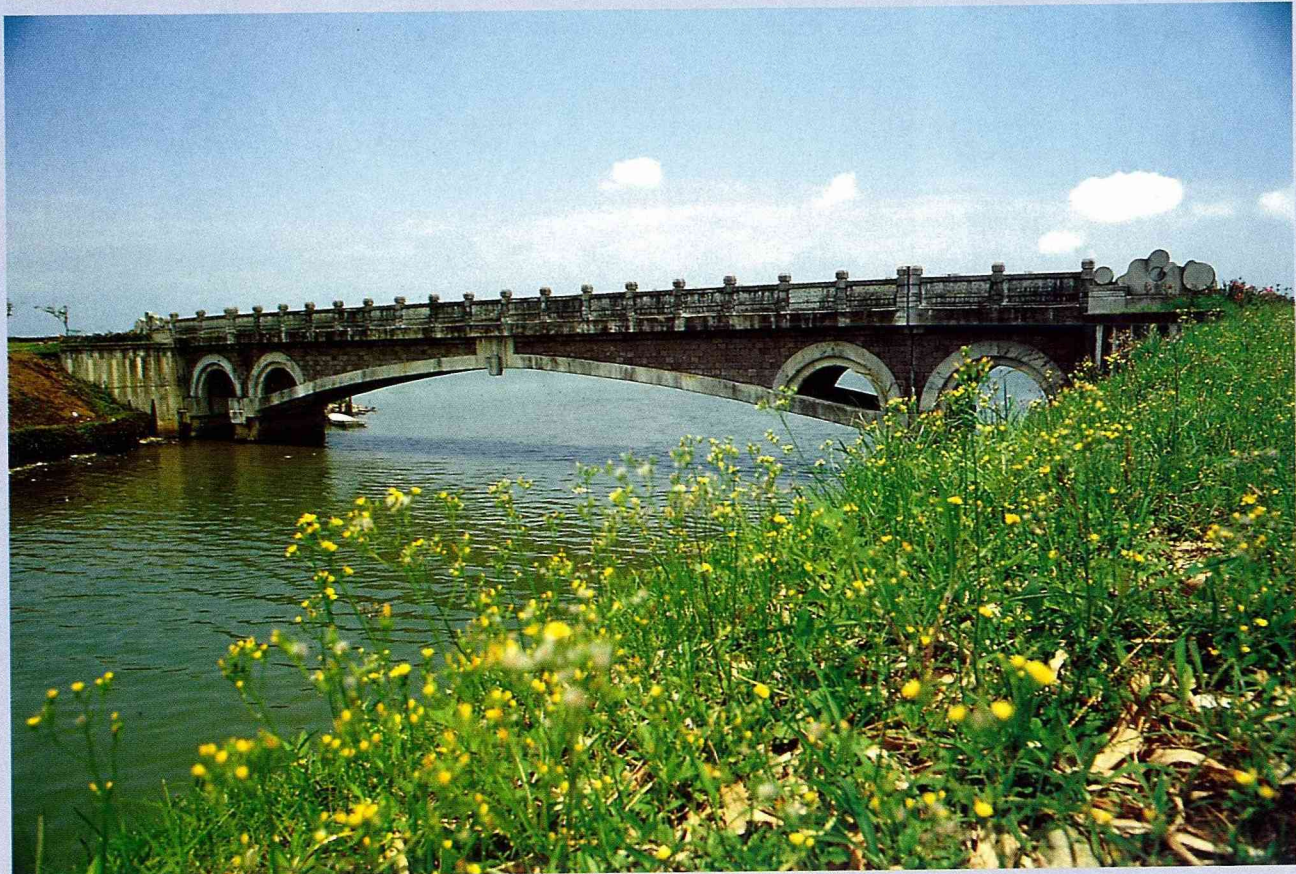
■ 冬山河上的仿古「安濟橋」。

原來宜蘭縣目前正推行「橋樑藝術化」的計畫，讓當地的橋樑，不僅是交通聯絡工具，更是一種公共藝術的呈現，詮釋著蘭陽平原的另類風格與地貌景觀，無論是安排一趟以橋為主題的「橋之旅」，或把橋當作旅遊途中的趣味景點，都非常具有吸引力。