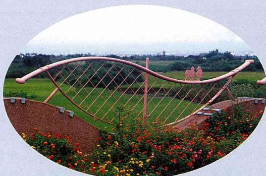
■ 泰雅大橋上，弓與鳥相容並存。

橋 是陸地上的交通設施，在人類精神生活中，也扮演著重要的角色。橋，打破了地理上的孤絕，銜接不同地域的人文風景，從甲聚落到乙聚落；先民的脚步，伴著開墾拓殖的雄心，在廣闊的天地間，跨過一座又一座的橋，走出文明發展的軌跡。