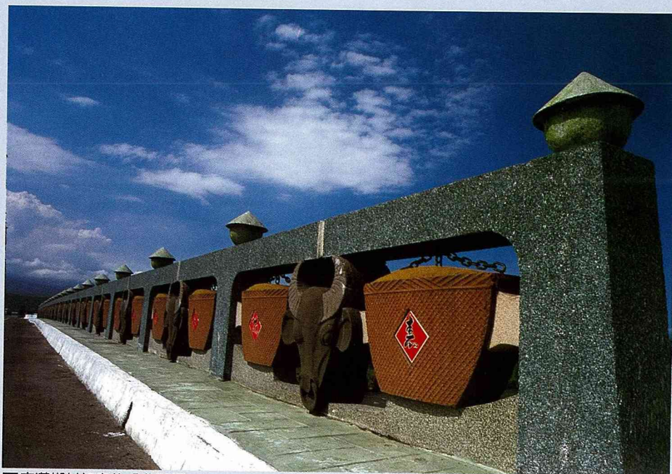
■充滿鄉村氣息的「農路橋」。

弓箭與鳥，意識形態上是相互敵對的，但在藍天白雲、青山綠水間，鳥兒悠然憩息在弓形橋欄上，象徵萬物相生相剋、和平共處，詮釋了生態循環的自然邏輯。