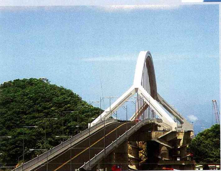
■「南方澳大橋」為亞洲首座單拱大橋。

「菜籃」，甚至是罕見的菜籃，在工商業社會裏，已很少見到家庭主婦手提菜籃上市場採購的情景。「菜籃橋」—多麼親切的暱稱，頗讓人興起思古之幽情。其實，當您親臨其境，目睹南方澳大橋後，即會發現其橋面的懸空跨幅、高