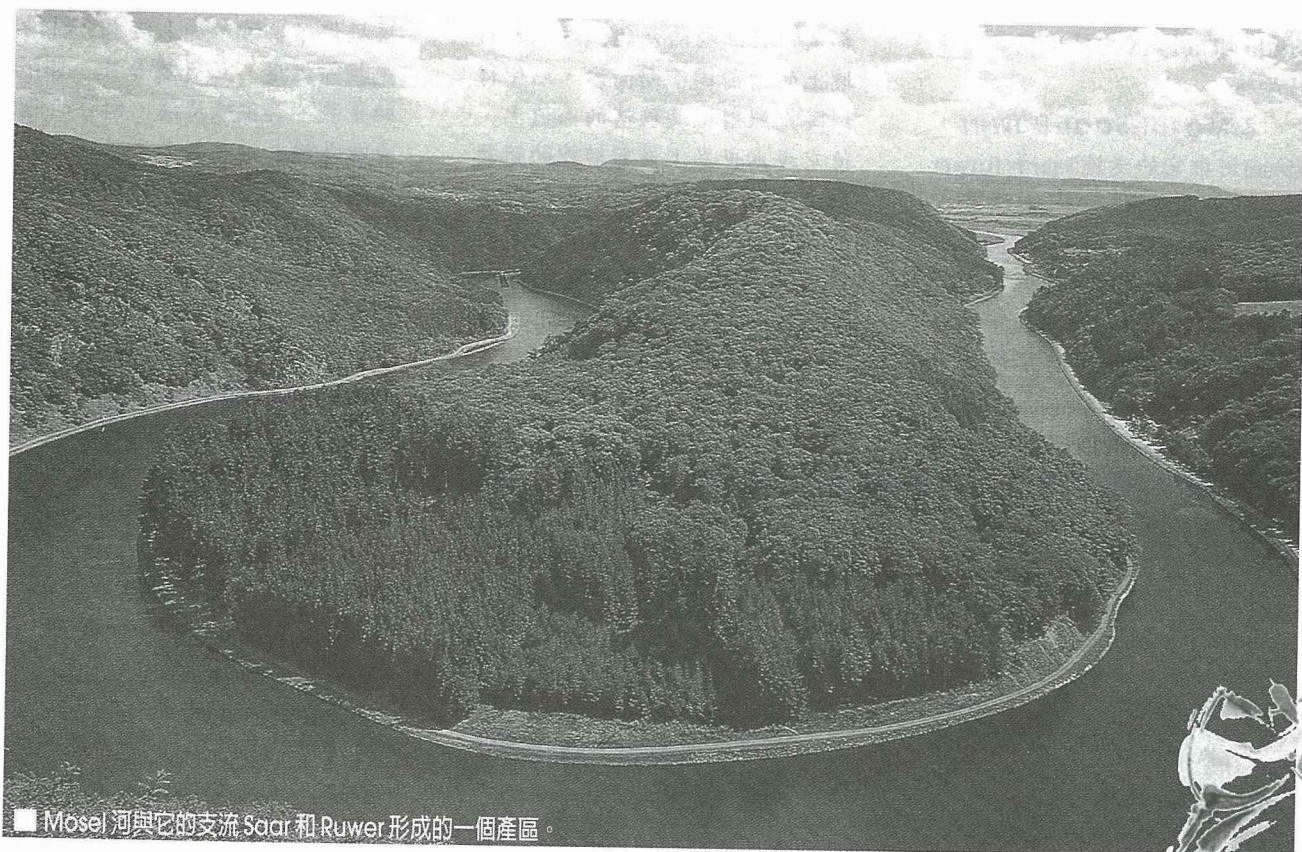
■ Mosel 河與它的支流 Saar 和 Ruwer 形成的一個產區。