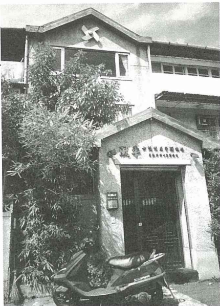
「風車女性健康管理機構」提供坐月子的食補送回家服務。

3.更年期：女性荷爾蒙結束，即更年期來臨，台灣女性更年期年齡約在49歲左右。如果平常沒保養好，女性荷爾蒙要結束前會有很多症狀，例如泛紅、神經質、骨質疏鬆症、心情沮喪...等。面臨更年期是另一個生理轉機，在生活飲食及坐息上好好調整可以化危機為轉機，改善生活品質，以女性平均年齡活到