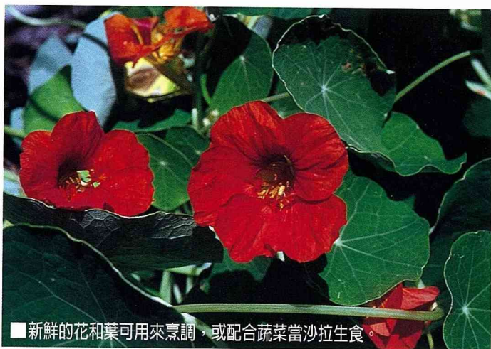
■新鮮的花和葉可用來烹調，或配合蔬菜當沙拉生食。

金蓮花為金蓮花科一、二年生或多年生草本，植株具匍匐性，蔓性莖多分枝，可伸展達4公尺之長，亦可攀爬他物而上，所以株身極矮，大約僅十餘公分。粉綠色的葉片，互生，葉圓型似荷葉，邊緣呈波浪狀，細長的葉柄比蔓性莖更具纏繞性，也能攀附他物而上。花朵類似戰士的盔，具花萼5枚，中下端合生成長筒狀，並向後方延伸成為「距」(Spur)，