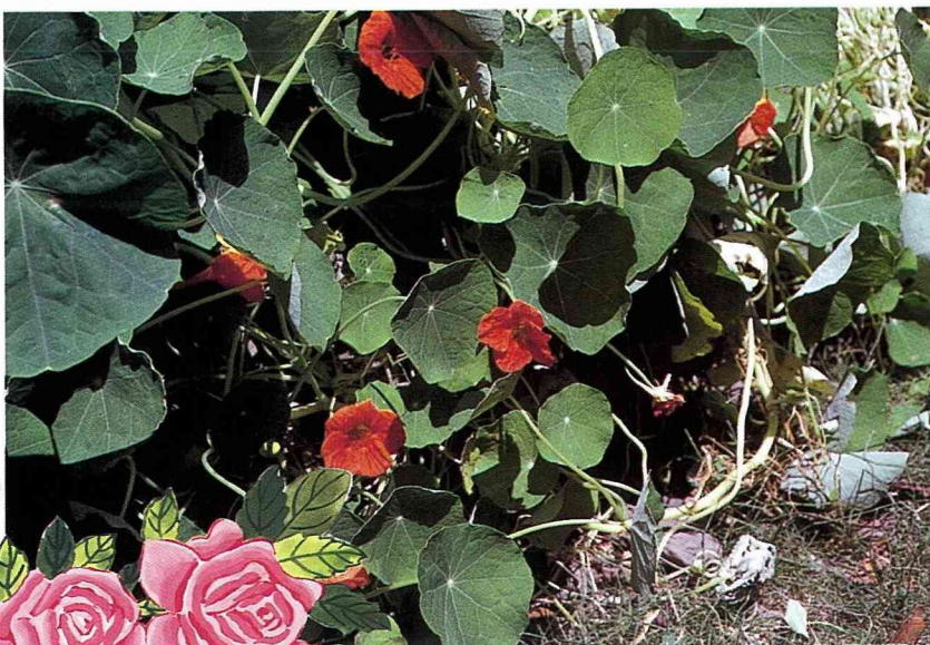
■ 全日照或半日照的環境，適合金蓮花生長。