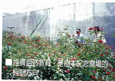
■推廣自然教育，是樹木紀念農場的經營方向。

分鐘車程，沿途有雷公埤、八甲觀賞魚養殖區、防空洞遺址、大湖風景區、貢仔湖柑桔專業區、二湖鳳梨專業區、崩山湖楊桃專業區、野生魚類養殖場、圳頭烤肉區、雙連埤生態保護區、福山植物園等多處景觀，誠然是蘭陽