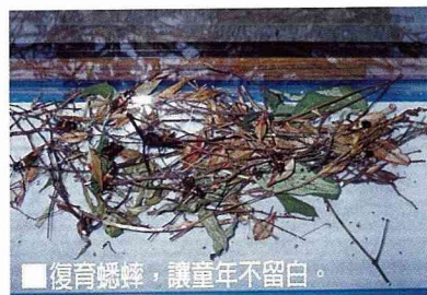
■復育蟋蟀，讓童年不留白。

蔬菜園有多餘的田地，租給都市人種菜，並在田間增設簡易炊具，由遊客自己動手採菜，自己處理烹調，享受田間美食。