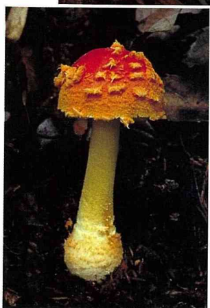
■紅托鵝膏的菌傘上有些鱗片狀塊斑，像極了童話故事中的小毒菇。