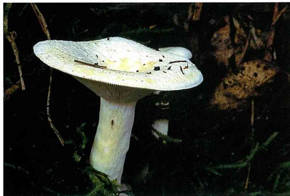
■ 當劃破乳菇屬蕈體時，會流出白色的乳汁。