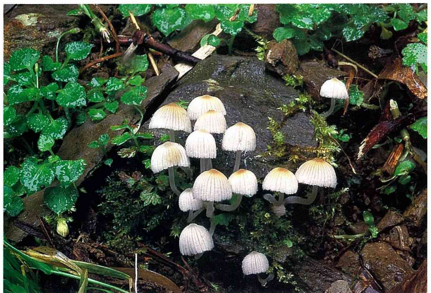
■ 簇生鬼傘為常見的小型菌菇，白色的蕈蓋卻在傘骨處勾勒出棕色的線條。