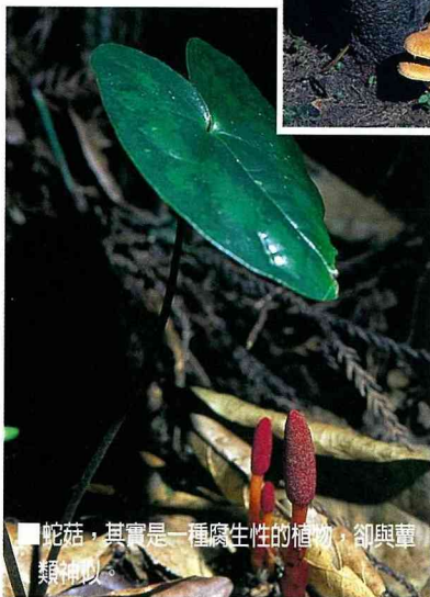
■ 蛇菇，其實是一種腐生性的植物，卻與蕈類相似。