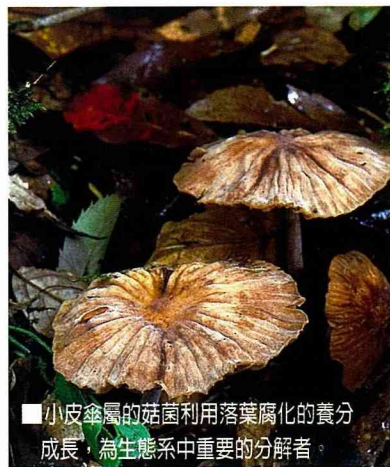
■ 小皮傘屬的菇菌利用落葉腐化的養分成長，為生態系中重要的分解者。

有些小菇菌著生於蔥綠蘚苔上，在微距鏡頭下，就像是一個留著娃娃頭的可人兒，隨著微風擺盪著纖細的身軀，讓人不由感嘆自然的奧妙；而有些則生長在山巒上，微開的蕈傘，頂著驕陽，彷彿等待著過路的登山客，為他們撐起小小的陽傘；有的更絕，配合周遭的岩石以及蘚苔，一如畫中的亭台，立於悠悠的山