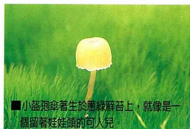
■ 小盜孢傘著生於蔥綠蘚苔上，就像是一個留著娃娃頭的可人兒。