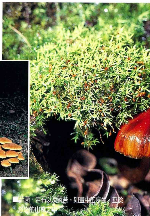
■ 菇菌、岩石以及蘚苔，如畫中的景緻，立於悠悠的山嵐之中。