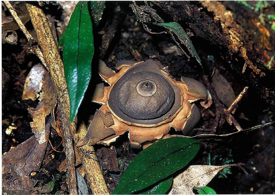
■ 擠壓地星屬菇菌的蕈體，會從頂端的開口噴出孢子，非常有趣。

地生性菇菌的種類繁多，自然在型態及顏色上就顯得極富變化。有些種類在菌蓋上有鱗片狀的塊斑，如紅托鵝膏( Amanita rubrovolvate )，就像她的好姐妹「毒蠅傘」一般，在鮮紅色的蕈傘上有些白色的斑點，然後配上一個白色的蕈柄，是不是像極了童話故事中的小毒菇呢？而有些種類則在造型上別出心裁，例如地星屬( Geastrum )的種類，顧名思義，他們就像一顆顆出現在地上的星星，非常有趣。不過更為特別的是，當你捏他們的時候，他