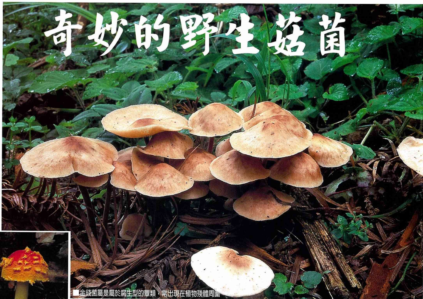
■金錢菌屬是屬於腐生型的蕈類，常出現在植物殘體周圍