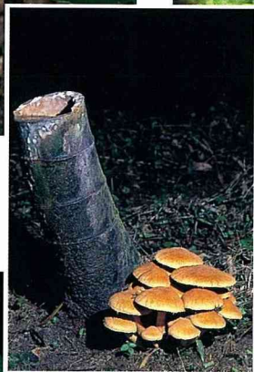
■ 橘黃裸傘常在夏秋之際，叢生於中低海拔竹林中，誤食後會引起中毒。