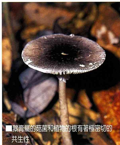
■ 鵝膏屬的菇菌和植物的根有著極密切的共生性。

有些小菇菌著生於蔥綠蘚苔上，在微距鏡頭下，就像是一個留著娃娃頭的可人兒，隨著微風擺盪著纖細的身軀，讓人不由感嘆自然的奧妙；而有些則生長在山巒上，微開的蕈傘，頂著驕陽，彷彿等待著過路的登山客，為他們撐起小小的陽傘；有的更絕，配合周遭的岩石以及蘚苔，一如畫中的亭台，立於悠悠的山