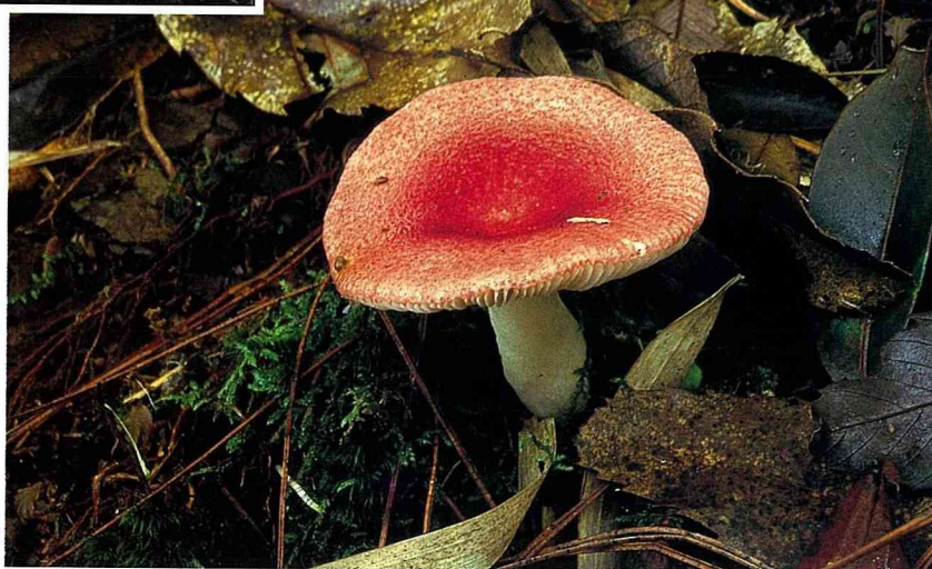
■紅菇屬的菇菌與樹木根系形成共生菌根，為共生型。

當 我們走在原野間的時候，常常不經意地發現一群既熟悉又有些陌生的嬌客，她們形態多變，不過大部分都戴著一頂顏色變化萬千的帽子——她們就是奇妙的野生菇菌。在台灣溫暖潮濕的季節裡，無論是在氤蘊的森林、草原或路旁，落葉或腐木上，都可以看到形形色色的菇類。野生菇菌的種類多而且分佈廣泛，與自然生態系及人類關係密切，她是自然界中最重要分解者，使大量的動植物殘體得以回歸大自然的循環。而有些菇類更與我們的日常生活息息相關，如食用菇類的香菇、金針菇及木耳等，以及具有藥用的靈芝、茯苓及猴頭菇等。