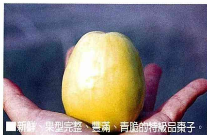
■ 新鮮、果型完整、豐滿、青脆的特級品棗子。

棗子，補氣養顏、益胃生津、富含維他命C，下回上市時建議聰明的讀者認清品牌的棗子品質絕對有保障，不過吃棗子可別囫圇吞棗，務必要細嚼慢嚥才不會有飽脹不適的感覺哦！