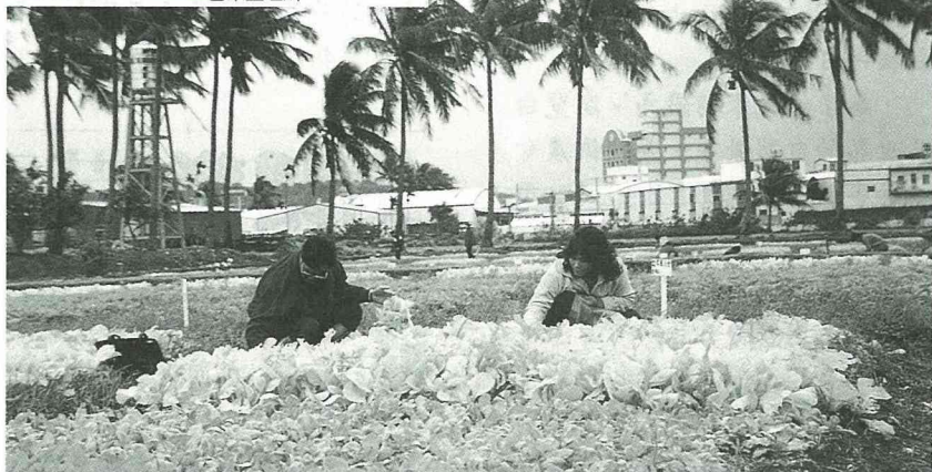
■ 市民農園讓都市生活有個喘息的空間。