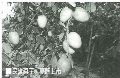
■ 民雄棗子，亮麗上市。