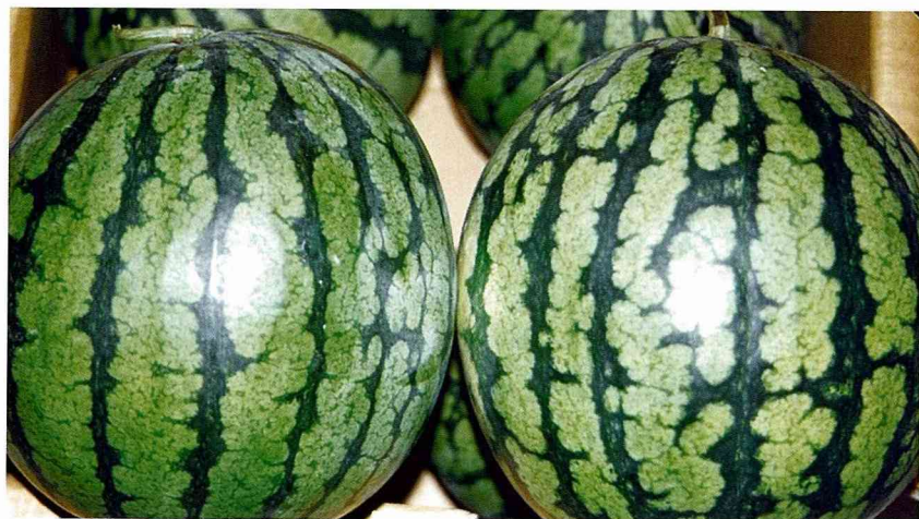
■瓜紋粗條明顯的特鳳小西瓜，包甜！

西螺果菜市場每天約有1萬公斤交易量，批發平均單價每公斤20~30元，冬春季以來自台南市安南區農會產銷班的產品品質最佳。夏秋天來自崙背、麥寮兩地品質最好。