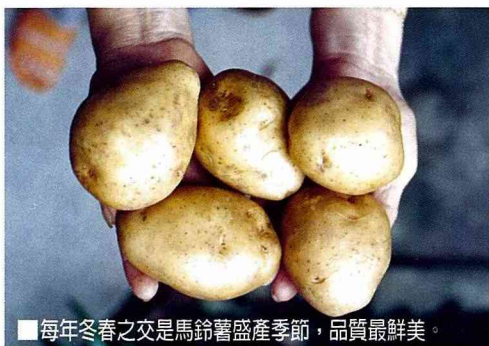
■每年冬春之交是馬鈴薯盛產季節，品質最鮮美。

茄 科茄屬多年生蔓性草本植物，葉互生呈羽狀複葉為橢圓形，開白、淡黃、粉紅等三色花。原產南美洲智利及秘魯。18世紀引入我國，本省早期由荷蘭人傳入，目前已成為重要經濟作物之一。別稱塊茄、洋芋、荷蘭薯、洋薯、洋山芋、日本番薯，因薯塊如馬鈴故名馬鈴薯。品種有五峰種、大葉種、卡地娜種、農林一號、歐米卡等。產期及產地均集中在12月至3月（冬春交接之季為盛產期），主要產地為豐原、石岡、后里、斗南、溪口、民雄、吳鳳等地方。栽培要領以原種行種子繁殖，經濟栽培以無性繁殖，即用薯塊萌芽，每塊可