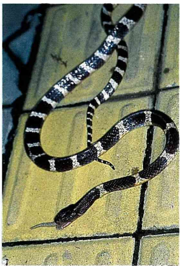
■ 雨傘節黑白相間的颜色叫人不得也難。

許是牠的名號太響亮，雖然性情極為溫和，鮮少主動攻擊人，但也逃不過被打死的命運。不過 白梅花蛇 更是無妄之災，因為遠遠一看，牠和 雨傘節 可說是如出一轍，長得極為神似。或許當初 白梅花蛇 是為了避免天敵捕食，而