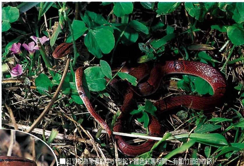
■紅竹蛇為無毒的中小型蛇，體色紅黑相間，有如竹節的紋路。

在台灣最常見的毒蛇莫過於赤尾青竹絲了！牠常常靜靜地盤繞在樹枝上，配合著絕佳的保護色，往往讓人一不留神就進入牠的攻擊範圍。所幸牠較不會主動攻擊人，因此即使發現也許只是虛驚一場。赤尾青竹絲的特徵在於牠的尾部為磚紅色，頭部成明