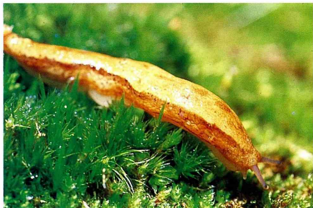
■ 蛞蝓是台灣鈍頭蛇最愛的食物之一。