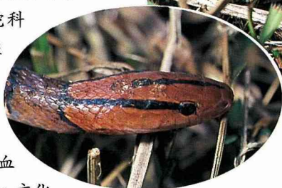
■紅竹蛇頭部有黑色線條，勾勒出捕捉獵物的倏捷神情。

顯的三角形。而身體兩側有一條白色縱線，有趣的是大部份雄性的個體在白色縱線下還有一條紅色的縱線。不過可有別的蛇要倒楣了，那就是和赤尾青竹絲有點像的青蛇。可憐的青蛇，性情溫和，卻被怕過頭的人不分青紅皂白的亂棍打死，真是冤枉呀！而青蛇的食性也頗為特別，牠是以蚯蚓為主食，和赤尾青竹絲可是截然不同！