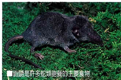
■鼯鼠是許多蛇類飽餐的主要食物。

介紹了青綠色的蛇，就得看看漂亮的紅竹蛇。紅竹蛇為無毒的中小型蛇，體色紅黑相間，有如竹節的紋路，棲息於全省低海拔的森林邊緣。而從一些研究顯示，他們的主要食物為小型啮齒類動物和鼯鼠。而牠們要獵捕這些刁鑽的小型哺乳動物，想必牠們一定練就了一身絕妙的功夫。不過蛇類的食物種類可不只於此，台灣鈍頭蛇可有另一番取食的特色。橙黃色的台灣鈍頭蛇為台灣特有種，由於缺乏頤溝，因而兩頷不能擴張，所以取食的對象是軟軟的蛞蝓，也就是無殼蝸牛啦！而牠搜尋的方式，就是利用吐信，探尋蛞蝓爬行時所遺留下來的痕跡，尾隨而至，然後就可以大快朵頤一番。