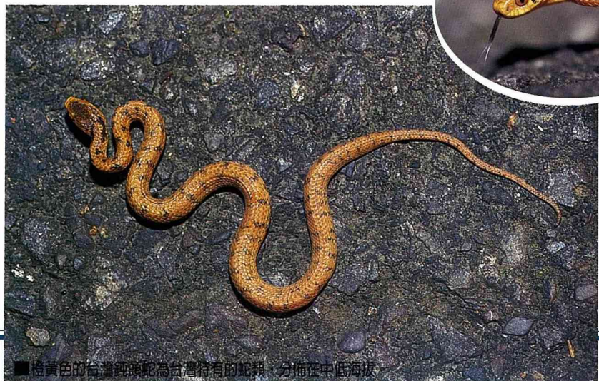
■橙黃色的台灣鈍頭蛇為台灣特有的蛇類，分佈在中低海拔。

介紹了青綠色的蛇，就得看看漂亮的紅竹蛇。紅竹蛇為無毒的中小型蛇，體色紅黑相間，有如竹節的紋路，棲息於全省低海拔的森林邊緣。而從一些研究顯示，他們的主要食物為小型啮齒類動物和鼯鼠。而牠們要獵捕這些刁鑽的小型哺乳動物，想必牠們一定練就了一身絕妙的功夫。不過蛇類的食物種類可不只於此，台灣鈍頭蛇可有另一番取食的特色。橙黃色的台灣鈍頭蛇為台灣特有種，由於缺乏頤溝，因而兩頷不能擴張，所以取食的對象是軟軟的蛞蝓，也就是無殼蝸牛啦！而牠搜尋的方式，就是利用吐信，探尋蛞蝓爬行時所遺留下來的痕跡，尾隨而至，然後就可以大快朵頤一番。