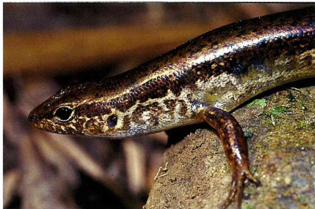
■ 雖然蜥蜴名為四腳蛇，不過也難逃被蛇類吃掉的命運。

除了蚯蚓、蛞蝓和小型哺乳動物之外，蛇類還會吃許多種類的動物，如常出沒於鄰近水域環境的 雨傘節 ，多以其他種類的蛇、蜥蜴、青蛙及泥鰍、鱔魚為食。所以在水田、溪流或水塘之岸邊，常發現他的蹤跡。不過或