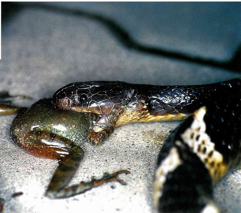
■ 常出現在水域邊的 雨傘節 正大快朵頤地吃著青蛙。