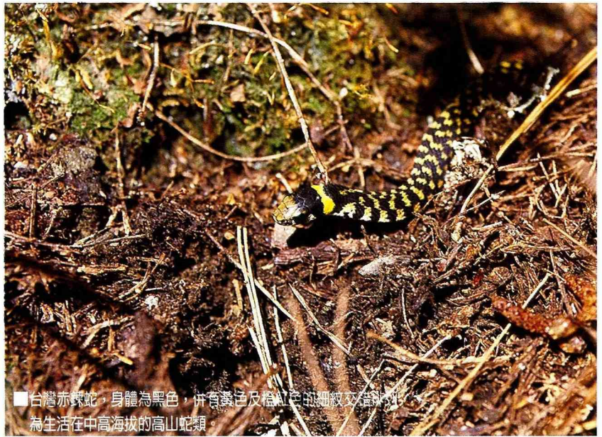
■台灣赤鍊蛇，身體為黑色，併有黃色及橙紅色的細紋交錯排列，為生活在中高海拔的高山蛇類。

台灣有許多美麗的蛇類，如台灣赤鍊蛇，身體為黑色，併有黃色及橙紅色的細紋交錯排列，為生活在中高海拔的高山蛇類。高砂蛇也是中高海拔中極為豔麗的種類。不過隨著人為的開發，許多蛇類變得極為罕見。也許是棲地的破壞，也許是人為的干擾，總之這群原野中奇特而神祕的遊獵者，漸漸消失了。或許我們正慶幸今後不再受蛇類的侵擾，不過值得憂慮的事才正到來。天上的鷹不再盤旋，原野中盡是猖狂的鼠輩，生態體系顯得搖搖欲墜，或許這是我們所不願見到的。所以讓大自然回歸大自