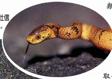
■台灣鈍頭蛇吐信來搜尋獵物。

顯的三角形。而身體兩側有一條白色縱線，有趣的是大部份雄性的個體在白色縱線下還有一條紅色的縱線。不過可有別的蛇要倒楣了，那就是和赤尾青竹絲有點像的青蛇。可憐的青蛇，性情溫和，卻被怕過頭的人不分青紅皂白的亂棍打死，真是冤枉呀！而青蛇的食性也頗為特別，牠是以蚯蚓為主食，和赤尾青竹絲可是截然不同！