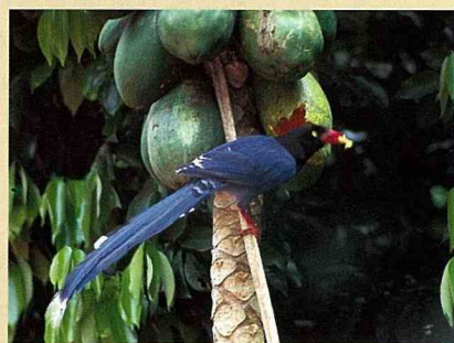
藍鵲飛過 一個藍鵲家庭的故事