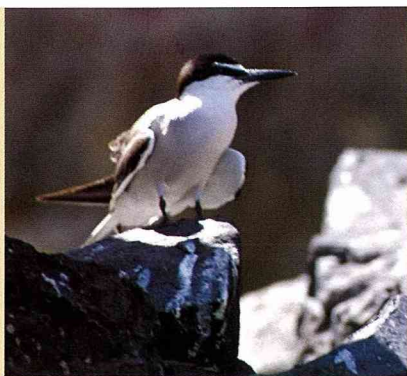
追逐夏日的鳥 台灣的燕鷗