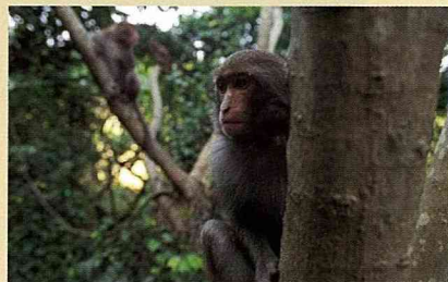
台灣獼猴 毛毛臉和她的朋友