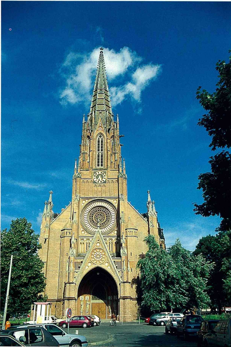
■歌德式教堂多為聚落中心的象徵。