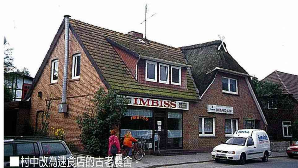
■村中改為速食店的古老農舍。

從以上的介紹，我們可以了解，所有傳統文化的保存與應用，在德國農村中都巧妙地與現代觀光活動相結合。農村的自然景觀、產業形態、特殊的空間風貌、歷史古蹟及民俗節慶，是吸引外來觀光遊客的主要原因。值得注意的是，這些條件都是與當地自然環境及歷史風俗長期結合而自然形成的結果；絕對不是經由人工刻意安排、無中生有的產物。