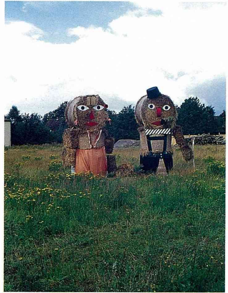
■矗立田間的稻草人。