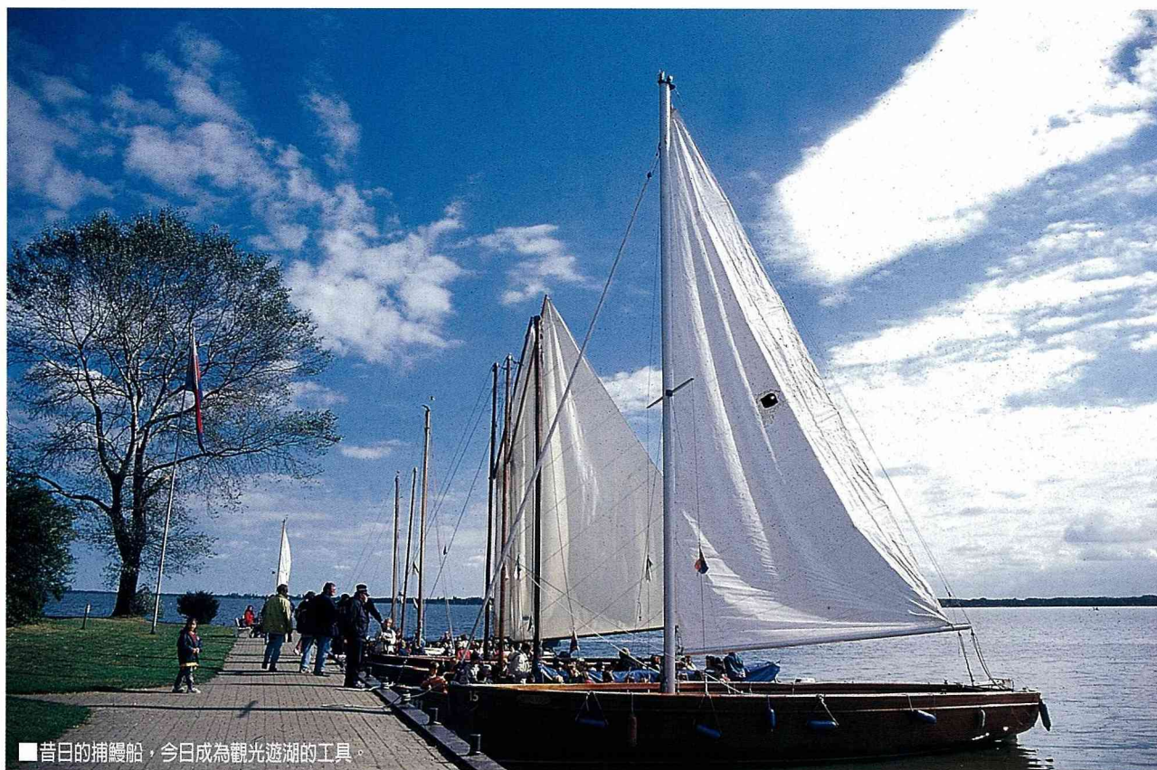
■昔日的捕鰻船，今日成為觀光遊湖的工具。

隨著時代進步，昔日捕鰻致富的盛況不再。配合遊客觀光的需要，原本用來捕鰻魚的帆船，在農閒季節自然成為搭載觀光客遊湖的最佳工具，每艘船約可容納20名乘客。因湖水極淺，乘坐風帆絲毫不覺恐懼，輕風拂面而來，反倒有一種陸上行舟的趣味感。頭帶絨帽、裹著厚夾克的老船長，端坐船尾，純熟地操控風帆，滿載著我們這一船前來取經的東方客迎風前進。雖然言語不通，但在他佈滿風霜的臉龐上，我看到了一種充滿自信的高貴氣質，還有恬適從容的生活態度。