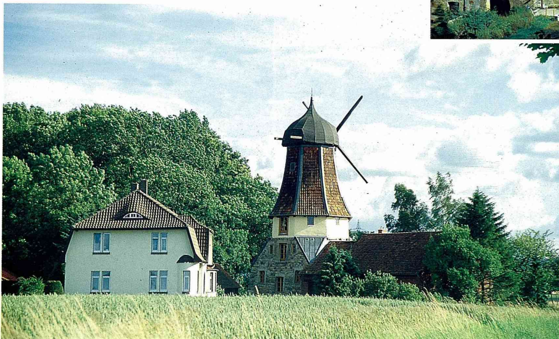
■風車及農莊是傳統農村的典型風貌。