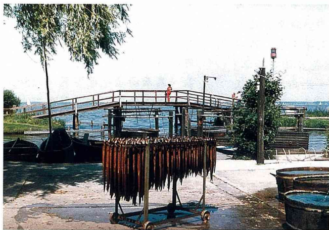
■ 史坦戶德村的鱈魚遠近馳名。

史坦戶德村（STEINHUDE）位於北德下薩克森邦，漢諾威市以西，距漢諾威機場約30分鐘車程。濱臨史坦戶德湖東岸，該湖湖水深僅2-3公尺，昔日曾是該邦海軍採練的重要基地，因其湖面寬廣，為德國境內所少有，四周森林環抱，景色宜人，故為德人假日攜眷同遊的休閒勝地。史坦戶德村憑藉地理位置之便利，長久以來，村民靠捕捉湖中野生鱈魚以為生計，並醃製成各類鱈魚加工食品出售。據說，湖中成鱈存活壽命均在20-30年之間，肉質鮮美，遠近馳名，享有「鱈魚村」之盛名。