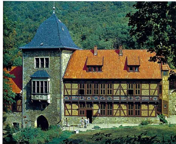
■位於山頂的古堡，也順應休閒潮流改成了餐廳與酒館。