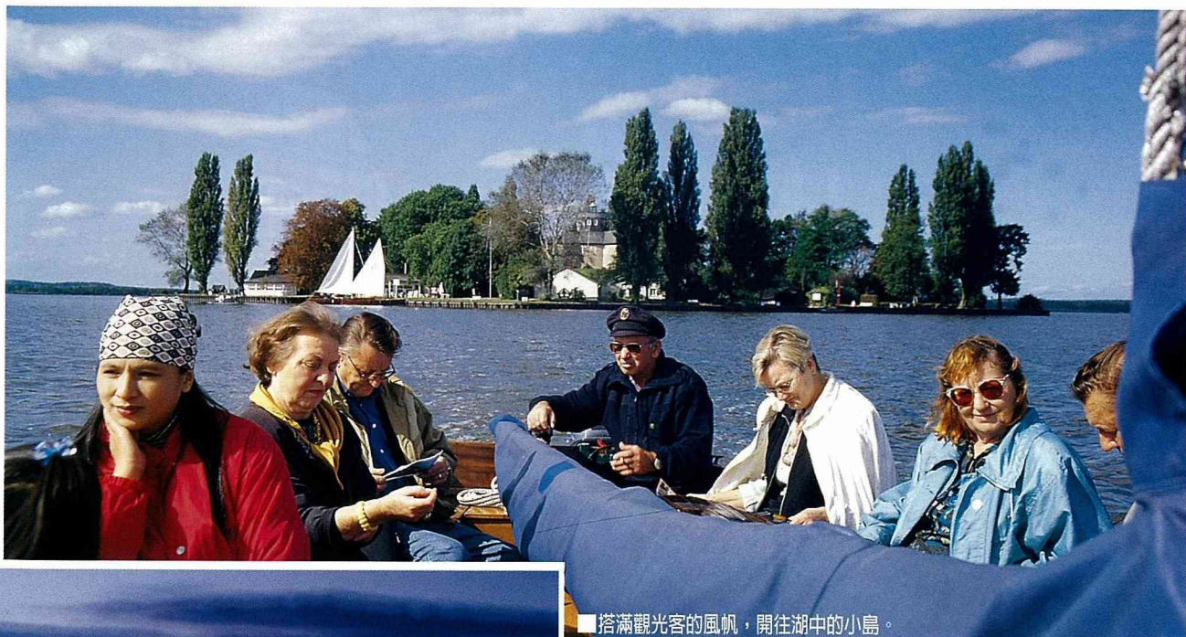
搭滿觀光客的風帆，開往湖中的小島。