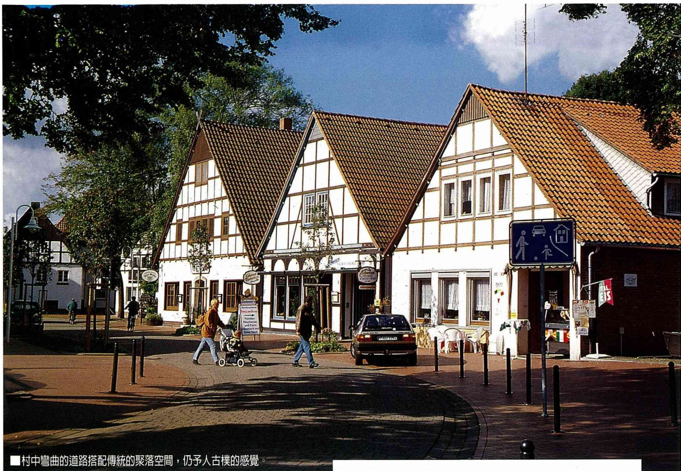
■村中彎曲的道路搭配傳統的聚落空間，仍予人古樸的感覺。