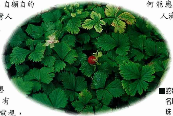
■蛇莓全家福，名地莓、雞冠珠、三爪龍。

採藥是一門學問。看！細緻地觀察植物的全貌，並且了解它的葉、莖、花、果、及根的特點。看形狀、顏色、看毛、看刺、看翅、看……看……。還要摸、聞一聞、嚐一嚐。這些知識如果編輯在課本裡有多麼的好！但是要考試大概就沒有人會喜歡了。只是這些草藥不研究，又如何能應用、救人濟世呢？