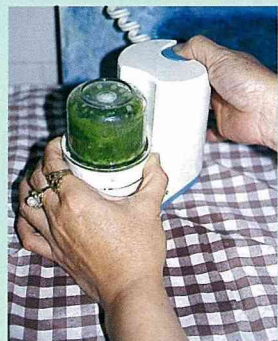
■攪拌打碎後，加以過濾。