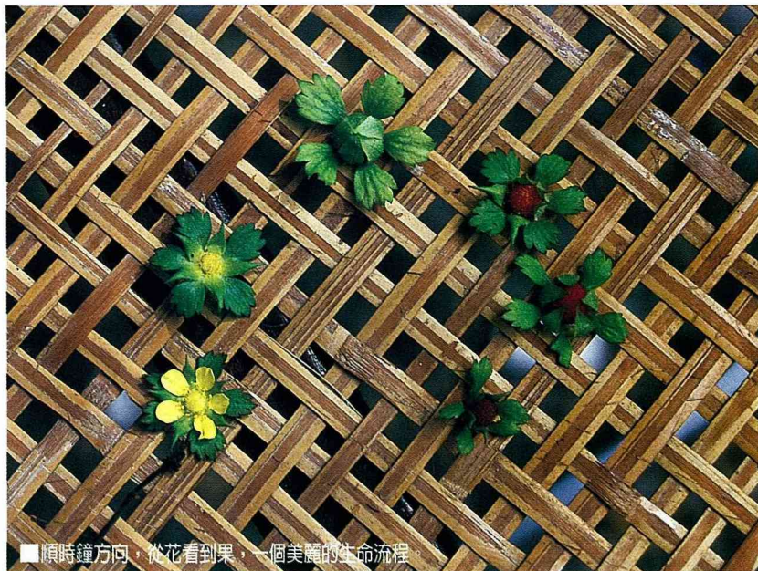
■順時鐘方向，從花看到果，一個美麗的生命流程。

從葉腋處，生出有毛的花柄，有一朵黃色的花，5片花萼，副花萼亦5片，副萼大且有5個淺裂口，花萼尖而小，二者形狀大小不同，俱為綠色。擁有5片美麗又小又薄的花瓣。花落時，花托為鼓起成球形；花萼遮擋著。緩緩的成長，漸漸露出淡綠、淺黃、再轉為紅色由淺漸深。長熟長大的蛇莓色澤美麗似鮮紅、深紅、圓圓的一粒、小巧可愛，就是像雞冠的紅色。