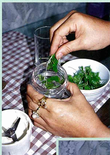
■放適量的蛇莓全草皆可，於拌泥器中。

蛇莓汁，趕上現在正流行的葉綠素防癌的摩登說方。高貴的生命源於美麗的大自然，蛇莓又名三爪龍，聽到「龍」這個字，中外馳名！傳統的吃法新樣式的產品，我們就取名為「三爪龍雞尾酒」，我喜歡，您呢？