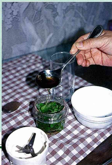
■加入少量的水，攪得動即可，不要滿出來。