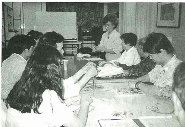
■有時候大夥兒也學學手工藝呢！