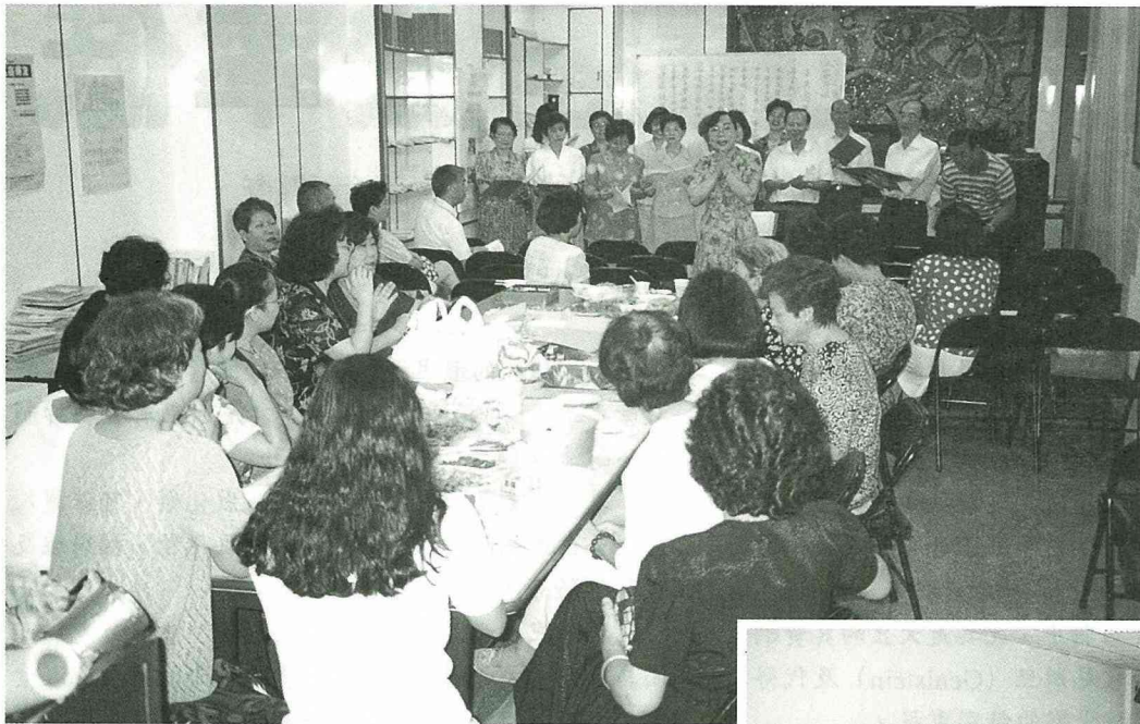
■聯誼茶會，熱情澎湃。