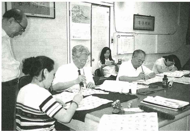
■ 董教授(左3)與抗癌人臨摹書帖，有板有眼哦！