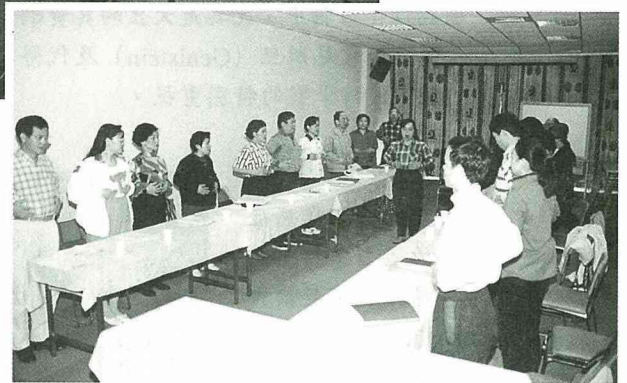
■大家一起學唱歌，您看！這是發音練習哦！