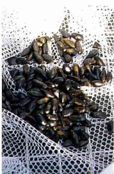
■洗淨種子。放在洗衣網日曬和風吹數日，乾燥之後，才不會發霉。

釋迦的種子平滑有光澤，又黑又硬。洗乾淨後，放在乾毛巾上，擦一擦，表面的水分很容易擦乾的，之後晒一晒，或放入一隻網袋內吹風幾天。當然我不是教您種釋迦樹，而是另有妙用。運用釋迦子作美勞或遊戲的材料。採用自然與手邊可利用材料，讓孩子思考、摸索，勇於嘗試。時有佳作，令人驚嘆，其效果絕對不會輸給現成的、工業化的、固定規格的、呆板的商業產品，天然的產品是有感情的、溫馨的、有生命力的。