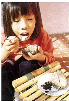
請享用釋迦。種子抿乾淨，放在盤子裡。

釋迦的果實形狀類似荔枝，原產外邦，所以名為番荔枝，屬番荔枝科，多年生的小喬木，果形相似釋迦佛祖的頭，又名釋迦。如今知道她的本名番荔枝的人反而少了。有些產地的農民，心存敬佛之由，改稱梨子或香梨。甜美的釋迦，含糖分極高。西洋人也給她取了一個可愛的別名—糖蘋果(sugar apple)，也很貼切傳神。