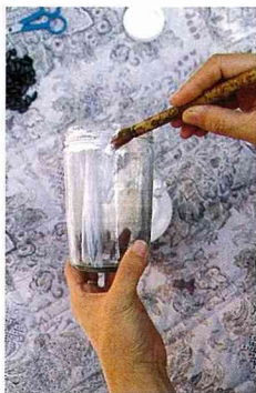
■用刷子或小毛筆，沾樹脂塗均勻表面。

有些孩子學習算術時，常常覺得枯燥乏味，艱深困難。懷疑學算術有什麼用，討厭的不得了，甚至逃避數學課。這時候孩子不僅需要您的鼓勵，還需要協助。尤其在學校跟不上進度時，非常的懊惱。您適時的引導與啟發，讓孩子找回信心。譬如設計一些情境，問一些有關算術的題目，以實際的生活為背景，學算術就有趣多了，他只要引出信心與趣味，再難的題目，他都會想辦法破解。