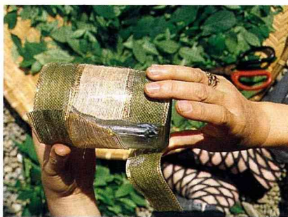
■順勢貼粘彩帶，注意要粘牢固。