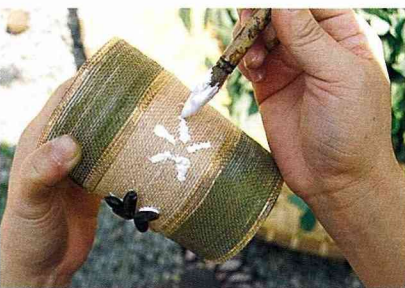
■粘上釋迦子，作為裝飾。