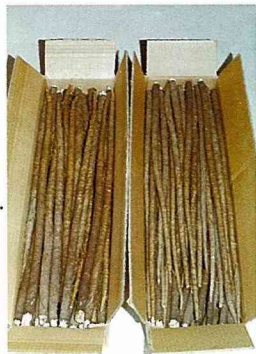
■上市牛蒡先以紙箱分級裝箱，供外銷或入冷藏庫，慢慢出庫銷售。

分，相當成人高。原產我國、亞洲、歐洲，早期由日本引入本省栽植，為台灣少量栽培蔬菜之一。別稱：吳帽、吳某大力子、牛菜、夜叉頭、蒡翁菜，藥學名稱「惡實」（本草綱目別錄）。本省栽培品種有瀧野川種（又分赤莖與白莖二種）、柳川理想、白月（白膚）種。2月上旬~4月下旬為採收期，可貯存至年底銷售。產地集中屏東市歸來里，面積約50公頃，佔全省75%產量，台南縣新化、雲林縣虎尾亦有少量栽培。