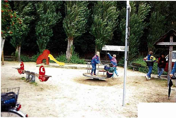
■村中設置的兒童遊憩場，小朋友玩得不亦樂乎。