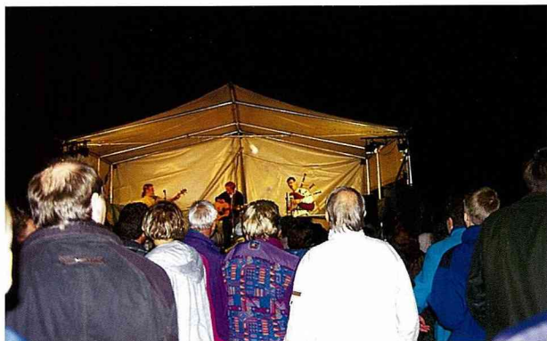
■遊客們正在欣賞煙火節的夜間街頭演奏會。

民宿中的廚房雖只佔了一處牆角，但在一組小小的德式廚具中，從冰箱、排油煙機、電子鍋爐、烘碗機、烤箱，小到咖啡壺、各種鍋碗瓢盆、各式酒杯、鹽、醋等基本佐料都有，真是麻雀雖小，五臟俱全。光是杯子的種類就有果汁杯、香檳杯、葡萄酒杯、烈酒杯、啤酒杯等，因爲有這樣高品質的廚房設備，讓平時不會動手燒飯的我們，幾乎一有空就合力完成幾頓美味可口的豬排大餐、烤鰻魚、沙拉、濃湯。民以食爲