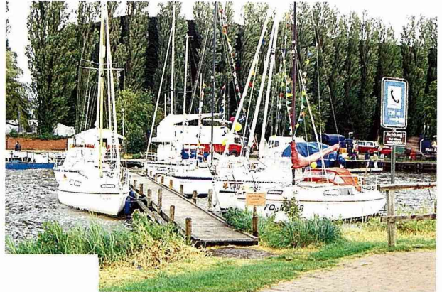
■湖畔的遊艇碼頭，提供多種水上的休閒活動。