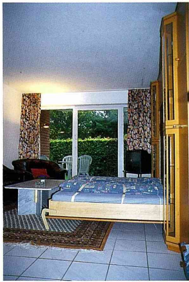
■「客廳變臥室」， 彈性運用空間。