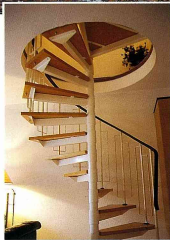
■連接閣樓臥室的螺旋梯，增加室內空間的利用。

房客需自行清理房間，若要像旅館般每天有人打掃，則每日每人需付清潔費3-5馬克，若一家四口則每日需多付15-20馬克，為了省錢，一般人多採自行打掃的方式，因為誰住在家中，會像旅館一樣的每天清掃呢？還不如省點錢，實惠點。