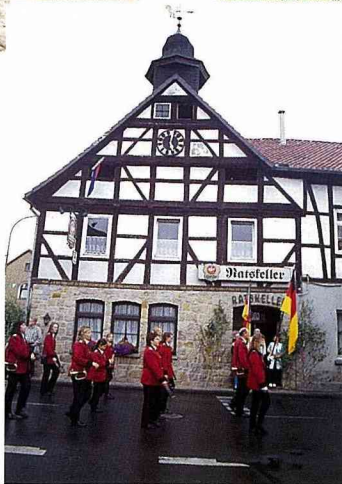
■煙火節的遊行活動。

在史坦戶德村，可以從許多的休閒活動如騎自行車、兒童遊戲場、乘坐馬車等，看出德國人對家庭式休閒活動及場地的費心安排與設計。貝