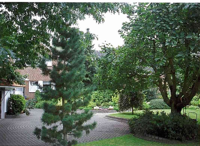
綠意盎然的休閒區是緩衝地帶，區隔房客與房東的生活空間。

顧名思義，「民宿」意指投宿、借住於民房；亦即將私人住宅的一部份予以更新，出租給旅客做為短期住宿用；經營者多為屋主本人，雖沒有大飯店的氣派豪華與眾多服務生，卻有房東的熱情招呼和「家」的溫馨，讓旅客就好像在自己住家附近旅行一樣。累了，回「家」休息；餓了，回「家」吃飯；睏了，回「家」睡覺；晚上