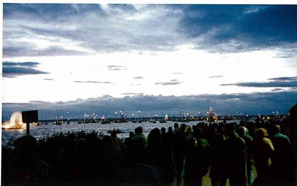
■船燈遊湖為煙火節帶入另一個高潮。

經過這次民宿的體驗，可以發現在農村發展民宿其實是改變農村產業結構及增加農民收入的好辦法。因民宿遊客需求而帶來的服務業及商業等，就是協助農民與其第二代轉型經營的契機，當然這要有很重要的先決條件，就是適當的農村土地利用規劃與正確的發展方向，才能創造出休閒農村的環境與建設。根據我們的觀察，農民的確可以輕鬆地經營民宿，從在德國8天中見到貝根太太的次數及其工作量來估算，一天的收入光我們這一團就有18人×50馬克/人=900馬克(約合新台幣17000多元)，說它是一項「極為輕鬆」的工作也不為過。台灣的農民朋友們，讓我們一起朝休閒農業的方向努力吧！