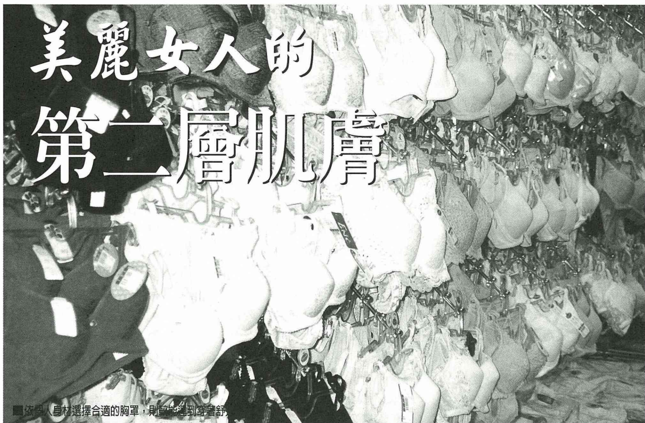
■依個人身材選擇合適的胸罩，則較能達到穿著舒適。

常 聽人說：「為何小小一件內衣，需如此價格？」，為此，身為消費者理應了解一些基本消費價值觀。以下乃有關各內衣品牌所研發的材質、種類機能、款式型態、價格、日常生活資訊方面，讓我們一起來認識它。