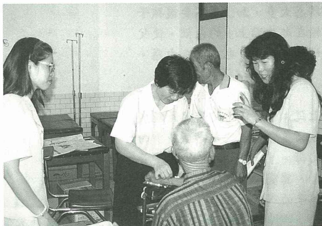
■家政指導員陪同高齡班員接受體檢。