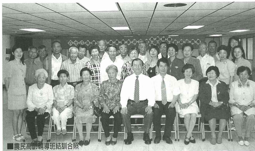
■農民高齡輔導班結訓合照

有一次，我充當司機，載送高齡班員去作體檢，其中一位班員告訴我，他們已經好幾個月沒有上街了！原來他們年是已高，子女離鄉就業，因此不便外出。我以玩笑口吻說：好，今天載您們繞街吧！大家都開心笑起來，聲聲親切的感謝，就是給我們最珍貴的回饋了！