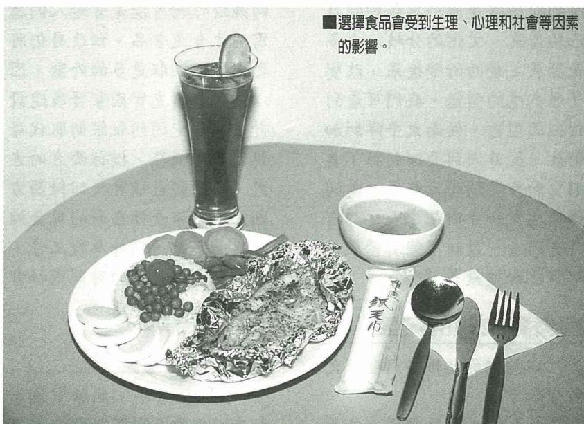
■ 選擇食品會受到生理、心理和社會等因素的影響。