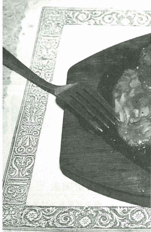
開發中國家西化之下，西方現代化的飲食取代了當地和傳統的飲食型態。

有些人對於飲食的改變可能會影響到健康，如新的飲食是營養的特殊字眼。因此營養專家也提醒我們要注意營養和