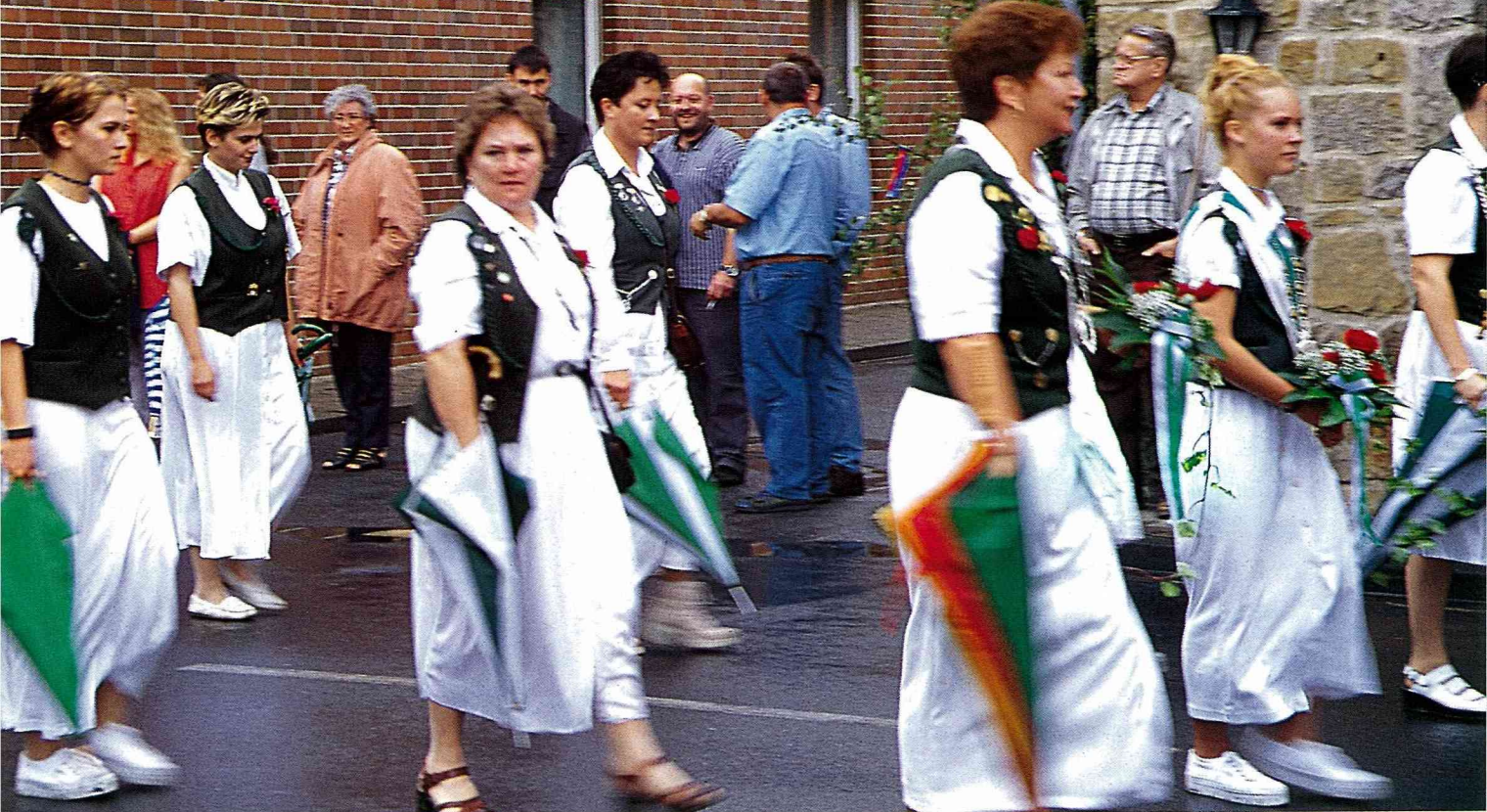
■農村俱樂部的遊行隊伍，成員穿著整齊制服。