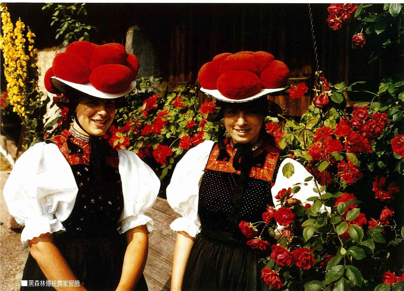
■ 黑森林傳統農家服飾。

什麼東西？等等一連串的問題；到了第二個村莊，人才剛到，鄉長和記者就在公所大門口接待我們了，於是大夥兒又再接受訪問；回到民宿的家時，地方報社的記者也被屋主通知來採訪我們。看來我們這批訪客並不寂寞，且在各地上市報。這使我們想到在德國農村中休閒真是大大小小的資訊都難逃記者們的“法筆”。這應歸因於休閒農業的各級經營者與新聞媒體的互動，產生這麼好的宣傳效果。於是我們在民宿農莊住宿期間，每天買水果與買菜，商店的人都知道我們是從台灣來的。原來農村的新聞報導也是與休閒發展息息相關及相輔相成的。