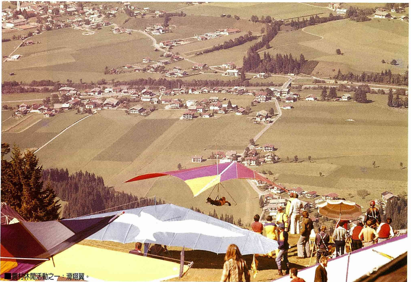
■農村休閒活動之一：滑翔翼。

例如我們走訪的 Wiezendorf 小村，有一個古老的風車，風車轉軸及葉片在一次大風吹襲後已經傾圮了有半個世紀之久，因沒錢整修而乏人問津。近年來爲了發展觀光休閒，一批年輕人興起了修復風車的念頭，於是找到了村中耆老與還懂風車的老農合組風車俱樂部，自動自發的將風車修復運轉，如今這座風車成了這個村莊的地標與賣點。你想知道古代風車如何以木齒輪配合石磨將麥子一粒一粒的磨碎與篩選嗎？你想體驗風車啓動時巨大的推動力與震撼力嗎？那你就非得花5馬克上去瞧瞧了！藉助門票收入，風車俱樂部業務蒸蒸日上。