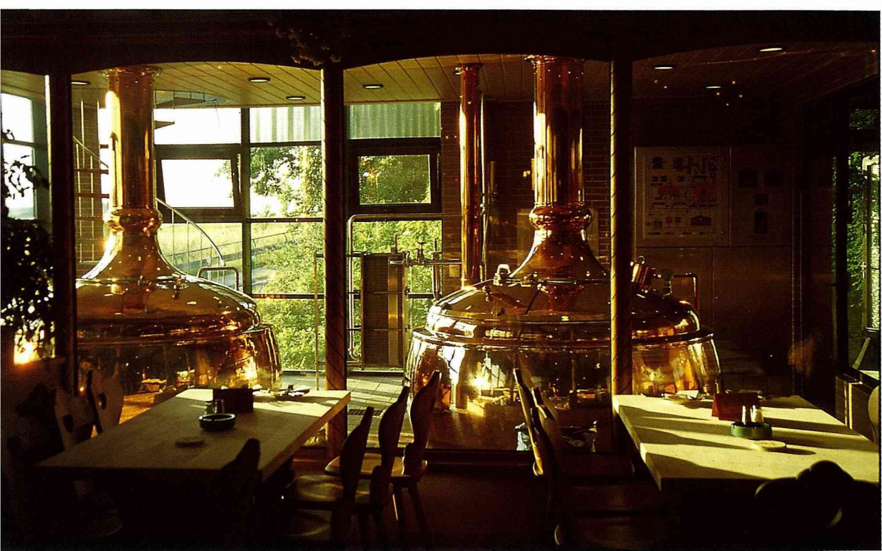
■啤酒廠的蒸餾大槽，開放參觀專人解說。

氣球著地後隨即舉行祈福儀式，感謝上帝讓我們平安歸來。儀式慎重而戲謔，首先你得跪在一塊紅地毯上，隨著儀式主持人唸上一段感謝的話，然後再由地面主持人持打火機點燃你的頭髮，在危急之際他會用啤酒澆熄頭上待燃的火苗。一切無恙後，頒發你一紙帶著這家印有合格公司執照的“搭乘熱氣球證書”。這項休閒活動除了驚險、刺激、逗趣外，還給人一種在空中的另類視野與思考模式，能讓人飛得高、看得遠、拋棄世俗的價值觀與束縛，感受自由自在“滑”與“飛”的樂趣。