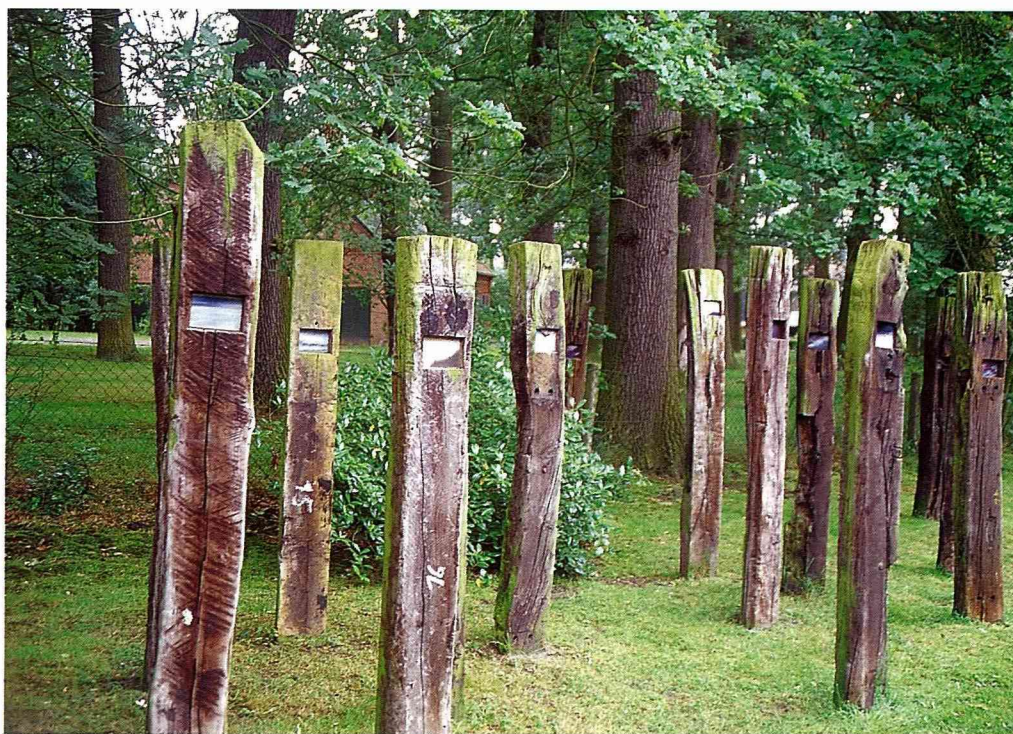
■火車舊枕木，草原新藝術。

農村的藝術文化在北德綠恩布格草原上隨處可見，我們走訪了新教村，這裡住著一群熱愛農村自然藝術的藝術家們。他們以農村自然的素材、木、石等材料，塑出現代感與趣味性的藝術品，供人思考如何與大自然相處與如何欣賞自然素材。他們還創造了許多藝術趣味結合休閒，讓人品味與遊戲。如一塊大石頭中間劈開一條縫，讓風從中穿過，附耳傾聽大自然的天籟與隨著風速產生的音階高低變化；也有藝術家們將淘汰的火車枕木術豎立在樹林中，然後在每根枕木上貼上一張模糊不清的照片，代表著人們從火車車窗