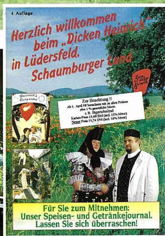
■ 「如果你喜歡我們的菜單，請帶回去作紀念。」

德國人是重視家庭休閒生活的民族，週末假日闔家走訪休閒農村十分普遍，適合闔家玩樂的公共設施也就十分普遍，尤其兒童遊戲或嬰幼兒玩耍的小沙坑更是不可少的必要設施。其他如騎腳踏車、兒童遊戲區、乘坐馬車、在農家撿雞蛋、喝羊奶...等等，足以吸引小朋友及小小朋友樂在其中。