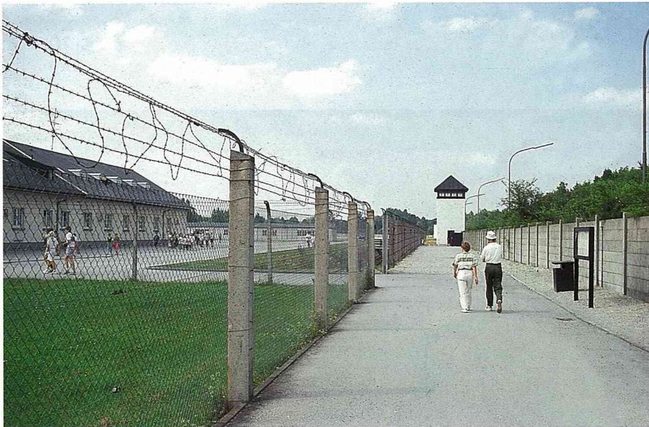
■ Dachau 集中營高高聳立的圍牆與鐵絲網。

了鄉村地區的吸引力，讓全德國人民及歐洲人都樂於前往農村休閒渡假。今天，德國農村轉型與休閒產業的蓬勃發展，是政策面下必然的途徑與結果。