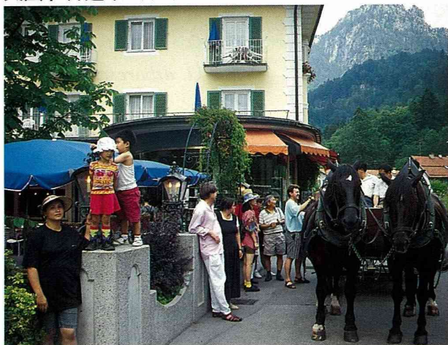
■到休閒農村乘坐馬車，是兒童的最愛。