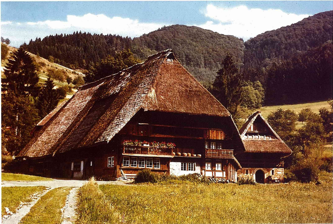
■黑森林露天博物館中的古老農宅原型。

外望的模糊觀景。這種懷念農村火車及枕木的藝術創造，頗令人激賞。這種自然素材的藝術創造者，也結合了一個俱樂部，配合農村休閒活動來發揚農村的藝術。