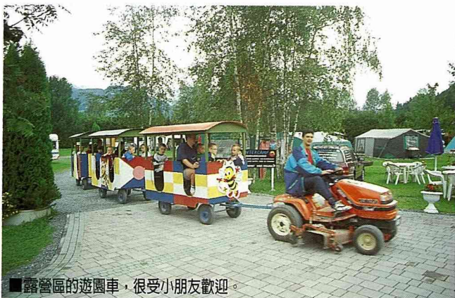
■露營區的遊園車，很受小朋友歡迎。

人們說德國是一個“club”國家。因爲他們三五個人就可以弄一個主題俱樂部來玩，如足球俱樂部、帆船俱樂部、面具俱樂部、風車俱樂部...只要想的出來的名堂，他們都有俱樂部。農村因爲有這些俱樂部，農閒時就常常結合在一起，舉辦展覽或遊行等活動，自娛娛人，這些活動幾乎是全村或鄰村的居民攜家帶眷來參加，人人穿著俱樂部的制服，十分正式，頗有看頭，非俱樂部的人就成了村中當然的觀眾，於是人人都有參與感。這種農民自娛的活動，使農村的盛會十分熱鬧；爲了舉辦這種農村活動，每個農村大多需要一個適中的廣場，供人群集散用，這種廣場平時可供農民集貨與販售用途，也可以停車或供青少年運動用；週末假日也在此舉行喝啤酒活動，或提供遊樂設施給兒童玩耍，充分發揮了廣場的多目標使用功能。