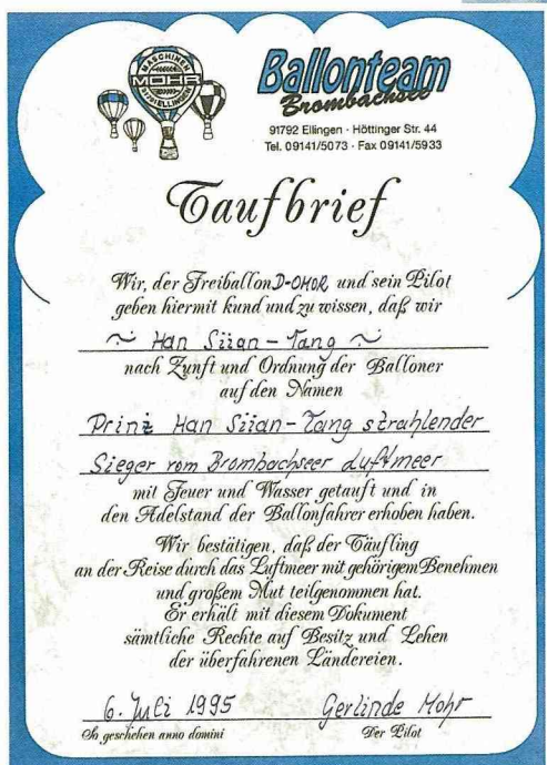
■韓選堂王子的搭乘熱氣球證書。