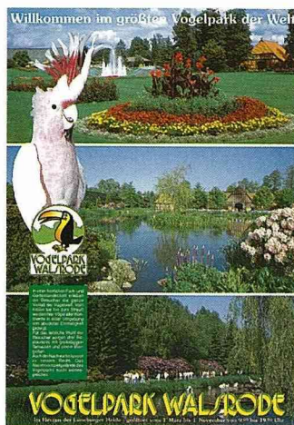
■ 農村主題公園之一：鳥園。

此行我們一路走訪了6-7個村莊，欣賞了無數的農村景點，品嚐了不少的地方餐飲。在德國農村本來外國的觀光客就少，一因語言二因行程安排不易，台灣的觀光客更是絕無僅有。當我們成群結隊的在村中走一趟，馬上吸引了眾人的目光。於是中午吃飯時，地方媒體記者就到了。訪問我們來自何方？為何到這裡休閒？最喜歡這裡