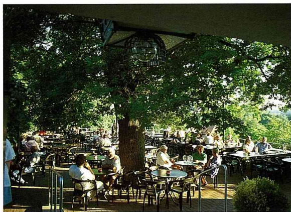
■ 大樹下享用鄉村風味的飲食，特別開懷。