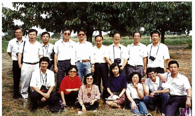
■路旁櫻桃樹，結實纍纍，任君採食，大夥兒笑容滿面。

散佈在廣大農村地區的遊樂區或一些歷史文化景點，在發展農村休閒上也能配合著發揮很好的遊憩功能，一些主題公園，如鳥園、恐龍館、各類的露天博物館，以及歐洲風情村等，均是佔