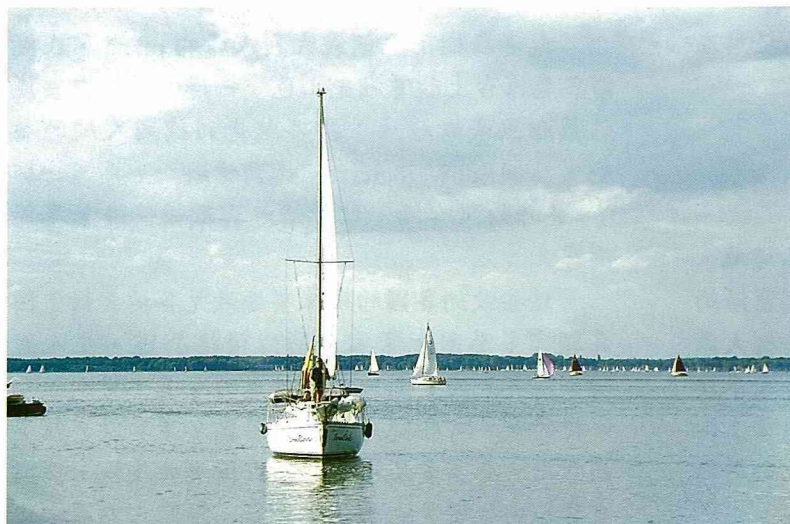
■農村休閒活動之二：風帆。

這些俯拾皆是的休閒活動，小從認識野花、野鳥、魚類與小動物，在各地湖邊、林中或保育區邊緣皆可看到解說牌與各類活生物。大的到各類傳統農村文物與露天博物館，鉅細靡遺的詳細解說與複製實物，甚或拆遷搬移的農村古蹟，均讓短暫到訪的遊客對農村歷史及文物，留下生動而深刻的印象。