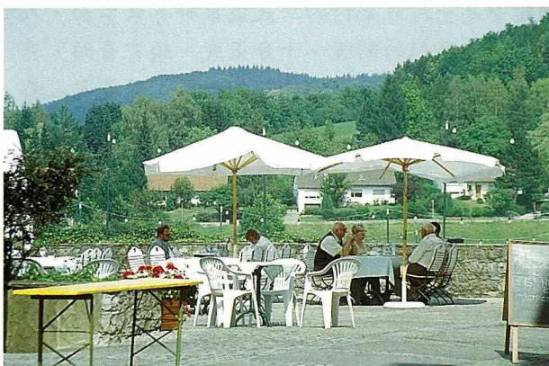
■ 鄉村餐飲，自然而富於野趣。

德國人是重視家庭休閒生活的民族，週末假日闔家走訪休閒農村十分普遍，適合闔家玩樂的公共設施也就十分普遍，尤其兒童遊戲或嬰幼兒玩耍的小沙坑更是不可少的必要設施。其他如騎腳踏車、兒童遊戲區、乘坐馬車、在農家撿雞蛋、喝羊奶...等等，足以吸引小朋友及小小朋友樂在其中。