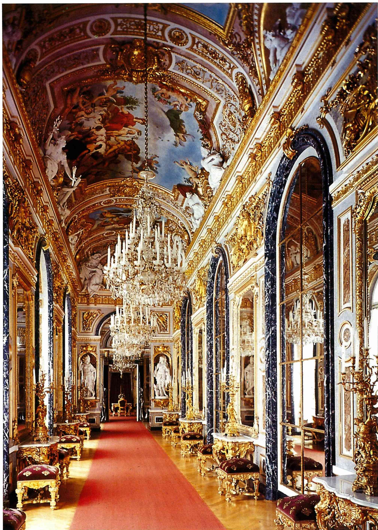
■金碧輝煌的巴洛克式皇宮。