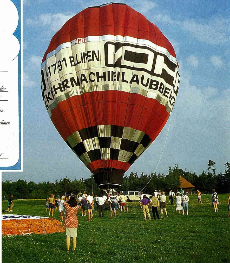
■升火待發的熱氣球。

的空檔可隨意瀏覽，大夥正在討論之際，菜就不知不覺已經上桌了。更可愛的是，在菜單的最後一頁還寫上“如果你喜歡我們的菜單，請帶回去作紀念。”這麼貼心且有創意的餐廳主人，保證你會喜歡他燒的菜。