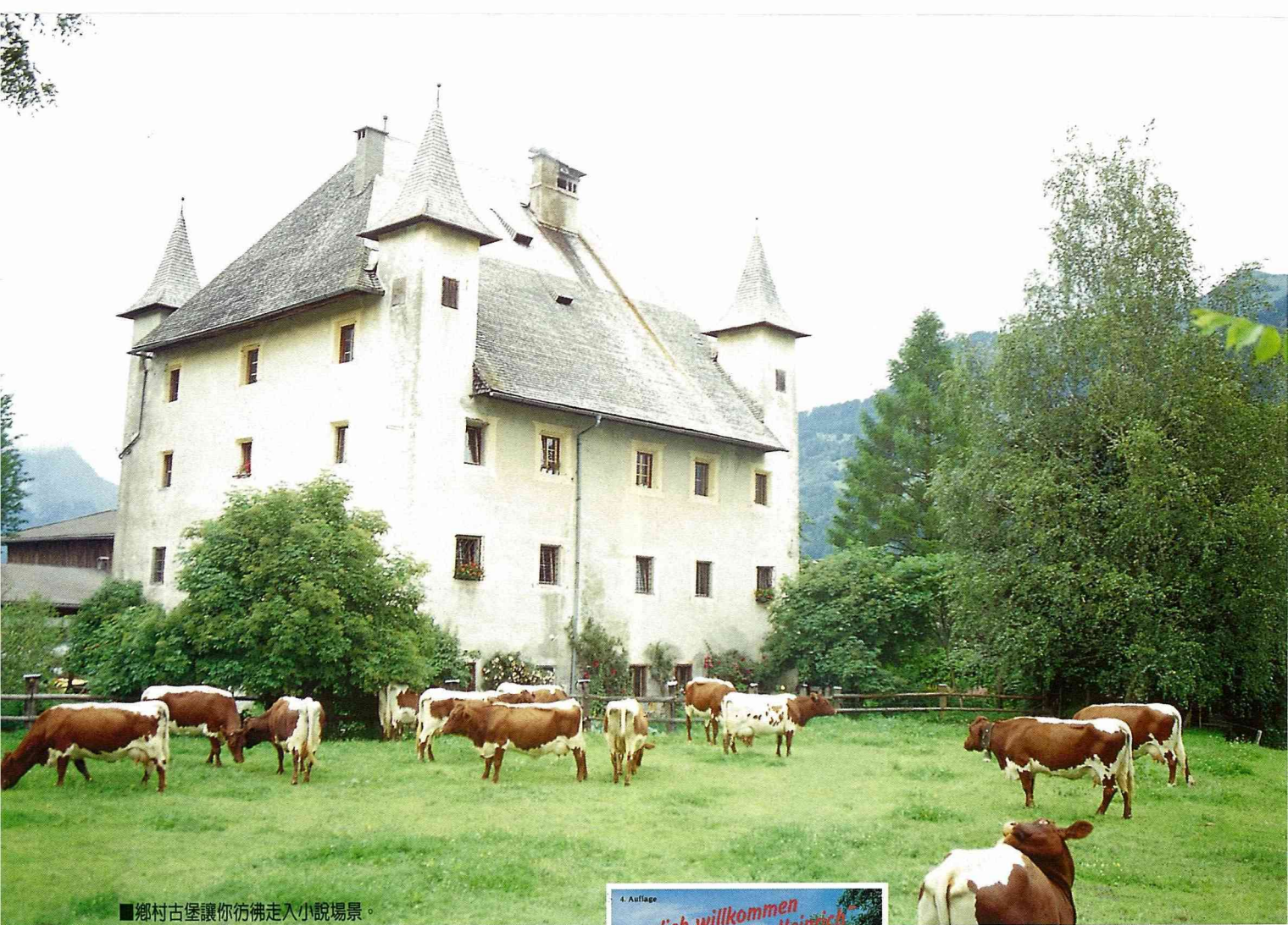
■ 鄉村古堡讓你彷彿走入小說場景。