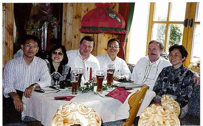
■ 0.5 公升的黑啤酒，是德國人的最愛。