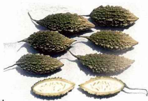
■ 鄉土山苦瓜成為新興菜餚。

葫 蘆科苦瓜屬一年生蔓性草本植物，分枝繁茂有攀緣能力，全株比一般苦瓜矮小，蔓有卷鬚和毛茸。葉廣大有5~7裂狀，開白色花，未成熟果皮為濃綠色，成熟果皮為黃或紅色，果型兩頭尖狀，果體只有一般苦瓜10至15分之一，果皮似為突瘤狀，苦味甚強。原產分布亞洲、歐洲等地，台灣原有野生種已有百年，近年來已馴化人工栽植，為流行於鄉野小餐館新興菜餚之一。目前上市供應餐廳的有果體小的野生種，及果體較大的馴化改