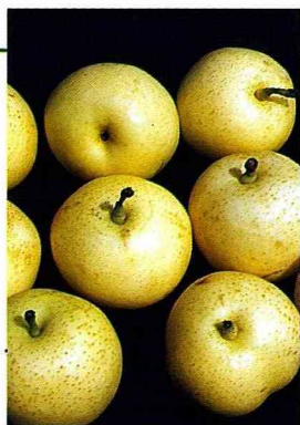
■ 汁多甜度高的世紀梨。

台灣梨的主要產地與產期，先由苗栗三灣鄉、大湖鄉、泰安鄉等產地於5~6月生產的小山梨（台北市場習稱三灣梨）上市，接著南投縣埔里、國姓、魚池、仁愛等中低度山坡地於6~8月採收的橫山梨上市。而台中縣和平鄉、新社鄉、桃園縣復興鄉、宜蘭縣大同鄉、南投縣仁愛鄉、信義鄉等中高度海拔山坡地於7~9月採收上市的高山梨，品種有幸水梨、豐水梨、世紀梨、新世紀梨、菊水梨、松茂