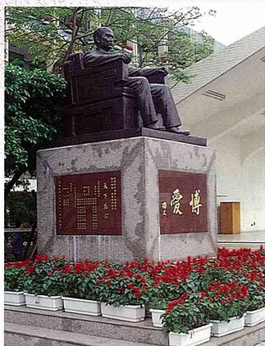
■一串紅即使簡單的種在花槽，沿著階梯擺設，也能在嚴肅中創造熱鬧的景象。