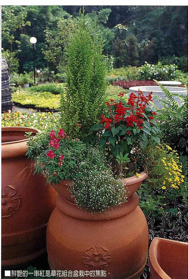
鮮豔的一串紅是草花組合盆栽中的焦點。

一串紅除了是台灣庭院中的寵兒，花瓣亦是壓花老師常用的花材之一，如果單以壓好之後的顏色表現，也許不能算是頂好，因為壓乾後的顏色有點陳暗，並不如預期的鮮紅明亮，但是在壓製時，如稍加注意調整花筒的角度，壓出來後恰似一隻活潑的小錦鯉，因此在以壓花寫景作品的水池中，常常可以發現它的身影，不得佩服壓花老師的巧手慧心。另