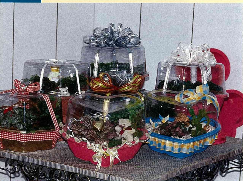
■完整包裝方便運輸的設計概念，讓盆花成為成熟的消費商品。

組 合盆栽為歐美日及國內近年流行的盆花應用方式，源自容器花園的創作概念，組合使盆栽的應用生活化、活潑化，直接提升盆栽的裝飾性、創造新產品形式，間接達到促進增量消費的目的。