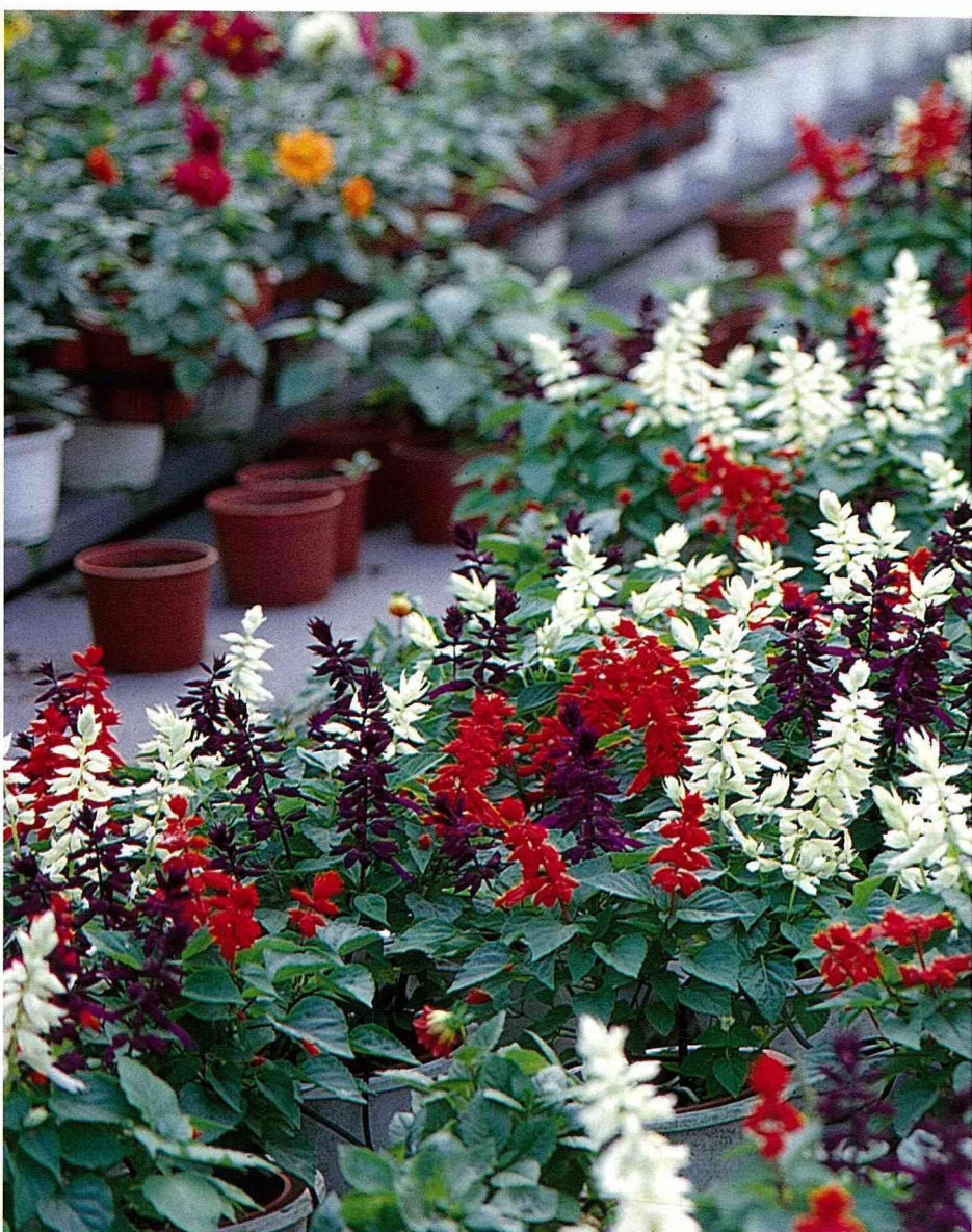
■一串紅產業的新契機在於育出新花色。

早期國內一串紅的採種可以結論說幾乎完全是委託採種，在沒有投入自有品種的選育工作為發展基礎時，雖然當時歐洲、美國、日本個最大的一串紅消費地，可能有80%以