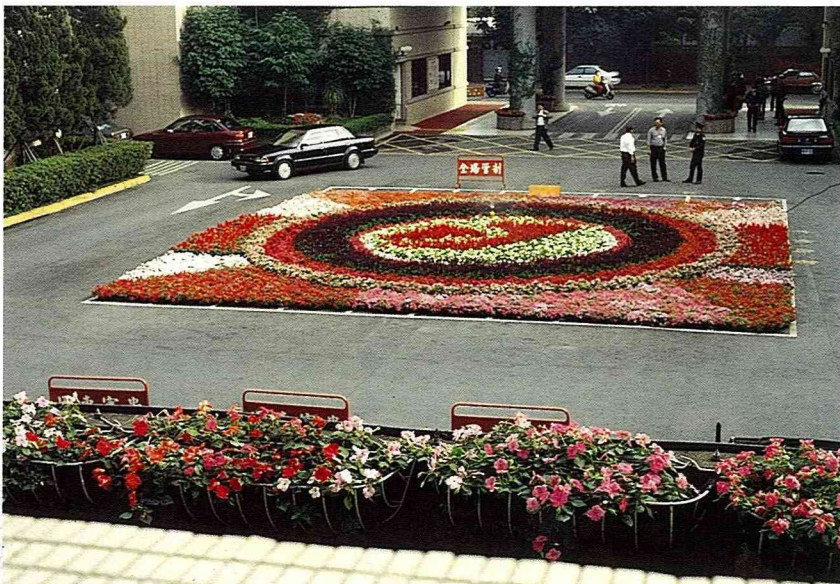
■這片壯觀的草花毯，其中醒目的紅、紫色都是一串紅的傑作。

一串紅的繁殖，在商業生產時以播種繁殖，雖然它是一年生的草本，照顧得宜，亦能成為宿根栽培，通常在花謝之後立即剪除花穗，能刺激側芽形成花穗，等花季結束後，離地面10公分處重新修剪、施肥，讓它重新生長，只是等待下一個花期的空窗期很長，如果庭院小，這樣可是像等醜小鴨變天鵝，與其要等很久才能想像它以後的美麗，不如當機立斷換新吧！一株才20元而已，老實說看一季，已經回本