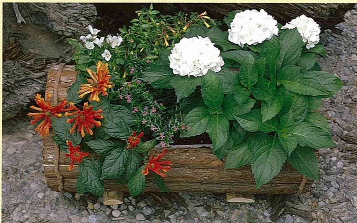
■相信自己也能輕鬆做得到，心目中理想的組合盆栽，和親朋好友一起來美化生活。