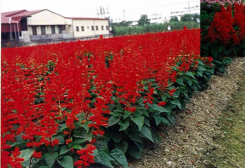
■一串紅採種田，曾經是嘉義以南的特殊田園景觀。(何以涼)

早在民國56年開始，日本阪田種苗公司，就相中本省南部嘉義地區，秋冬季涼爽乾燥的氣候條件，適合一串紅的生育，且採收種子的品質嘉，其千粒重高及發芽率均較當時其他地區採種為佳。讓國內一串紅的採種事業，曾經一度是歐、美、日本國家相爭委託採種的區域，業者回憶當時約莫有5-6家較有規模的公司，投入這項業務，全盛期在民國68、70年到80年。