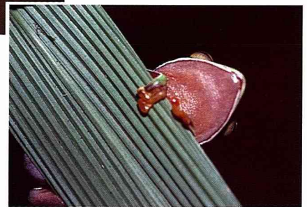
■橙腹樹蛙橙色的肚子，果然名符其實。

牠們活動的地點多在數公尺高以上的喬木枝條上，若非不小心下到森林底層，還真不容易看見。所以，如果有機會在野外看見橙腹樹蛙，可別忘了多觀察牠們一下喔！