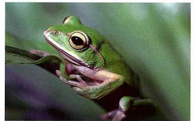
■翡翠樹蛙眼睛後方金黃色的顯褶，是台灣其他綠色蛙類所沒有的。

始森林中，不過發現地點十分零星，也許是因為才剛發現不久吧！牠最大的特色就是那一片橙紅色的腹部了，搭配墨綠色的背部，讓人一眼看見就印像深刻，無法忘懷。另一方面，和其他樹蛙比較起來，牠