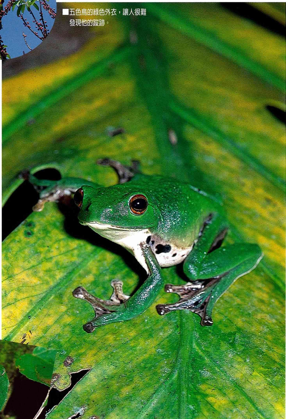
■莫氏樹蛙是台灣最常見的綠色樹蛙，紅紅的眼睛和綠綠的身體，對比十分強烈。