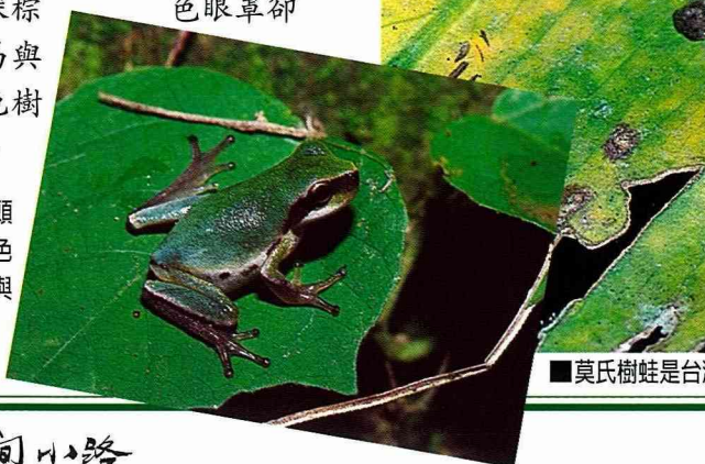
■中國樹蟾頭部有深棕色的眼罩，與樹蛙分屬不同科。

中國樹蟾是一種特別的蛙類，雖然在演化上和蟾蜍有較相近的血緣關係，但牠們的腳趾卻也有吸盤，而會在小灌木上活動，因此被分類為樹蟾科的青蛙。在台灣只有一種樹蟾，雖然牠的背部是綠色的，但是明顯的深棕色眼罩卻十分容易與其他綠色樹蛙區別。