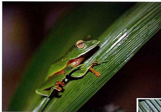
■綠色的橙腹樹蛙，巧妙的融入背景中。

著環境改變深淺。另外，牠們大腿內側呈橘紅色而散佈許多黑斑，則是另一項明顯的特徵。莫氏樹蛙的分布範圍十分廣泛，在全省兩千五百公尺以下的森林與果園中都可以看見牠們的蹤影，不過即使如此，