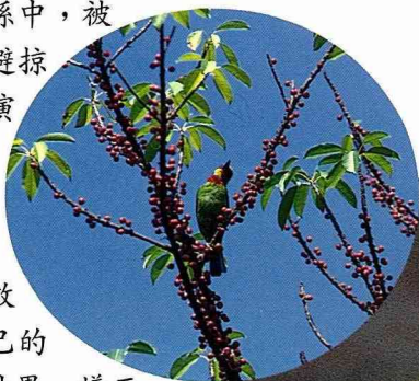
■五色鳥的綠色外衣，讓人很難發現他的蹤跡。

在 自然界中有許許多多的動物生活著，有些動物以植物為食，有些則是以其他動物為食。在這樣的關係中，被捕食的動物為了躲避掠食者的追殺，於是演化出各式各樣的形態，藉以保全自己的性命。保護色就是其中一項十分有效的策略，藉著讓自己的身體的顏色變得和外界一樣而隱藏自己，騙過捕食者的眼睛。而在綠色的森林中，綠色也就成為最常見的保護色，許許多多的動物都具有綠色的外衣，像是毛毛蟲、綠金龜、五色鳥、小青蛇等等，而其中最讓人驚艷的，也許就是跳躍在樹梢之間的綠色樹蛙了，今天就來為各位讀者介紹生活在台灣的綠色樹蛙。