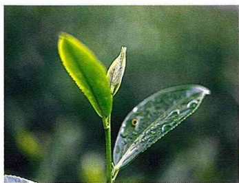
■ 新綠茶葉，日月精華。