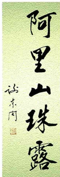
■ 有如旭日東升的「阿里山珠露茶」。