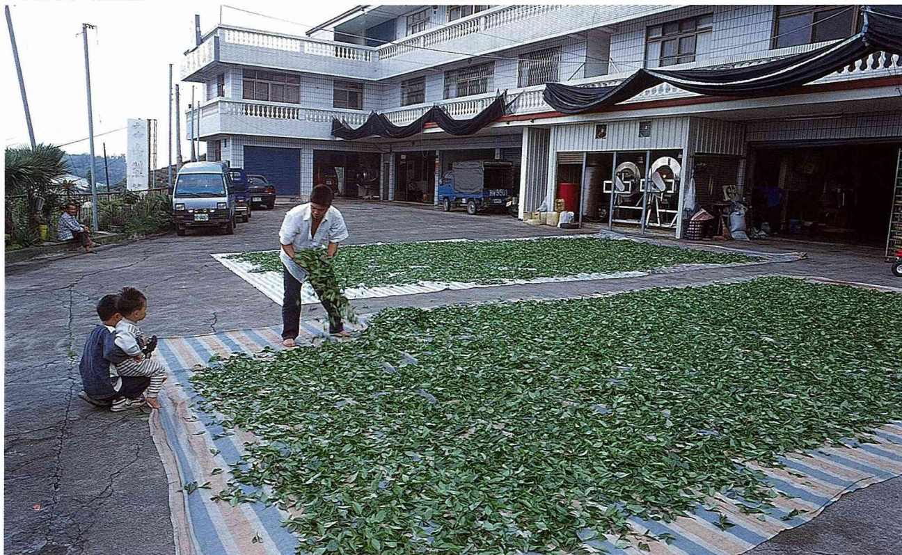
■日光萎凋，茶村特有景觀。