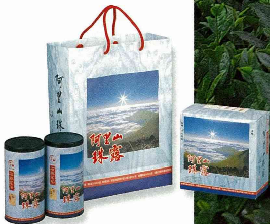
■ 石棹的優美茶園，引人駐足。