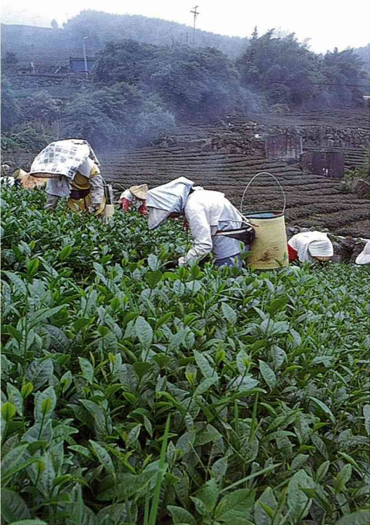
■手採茶菁，甘醇香濃。

石棹「阿里山珠露茶」之特色，在於完全手採軟嫩茶菁，焙製方法獨特。茶葉外觀呈翠綠半球狀，茶湯蜜綠色；入口即有一股高山茶特有的幽雅香氣，與清純甘潤的滋味；滿口含芳，喉韻無窮，常飲能促進新陳代謝，提神解勞，讓生活充滿高雅的情境與氛圍。