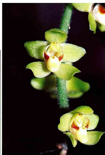
■大蜘蛛蘭成串綠黃色的花，沒有葉子的襯景，顯得更加醒目(微距鏡頭下的花朵)。