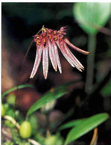
■蘭花總是賞心悅目，歡迎大家一起進入小小蘭花世界(紫紋捲瓣蘭)。

其他如常見的台灣松蘭，成群的盤繞在樹幹或樹枝之間，花形也頗為奇特。唇瓣形成大大的囊袋，還綴飾著花紋，搭配著不太協調的其他花瓣，或許這和她的傳花粉塊的蟲媒有著特殊的演化關係吧。迷你蘭花何其多，有些以造型取勝，有些則以量取勝。不管如何蘭花總是賞心悅目，歡迎大家一起進入小小蘭花世界，從中感受生物的多樣性。 翹