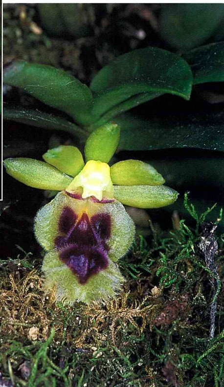
■台灣香蘭是最出色的袖珍蘭花之一。