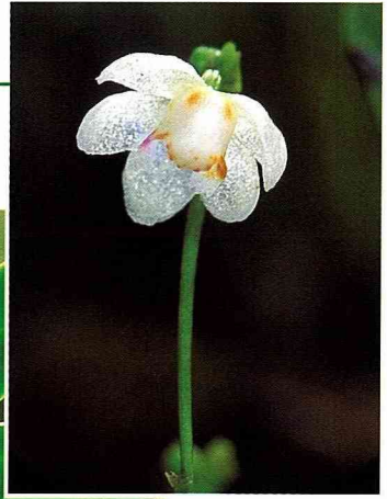
■金唇風鈴蘭，像懸垂於樹梢的鈴鐺，隨著徐徐的微風擺盪。