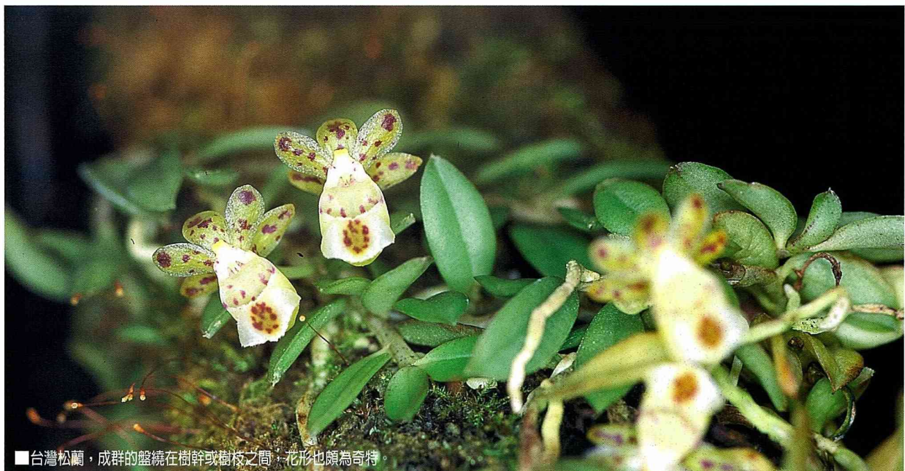
■台灣松蘭，成群的盤繞在樹幹或樹枝之間，花形也頗為奇特

台灣最迷你的蘭花到底是誰呢？我想的應該是莪白蘭吧！他們具有極為扁平而兩列互生的葉子，在其他蘭屬植物極為罕見。莪白蘭的花密生於花軸，而每朵花僅有1到3公