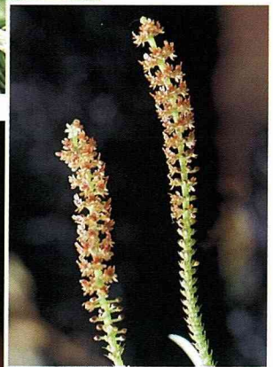
■蕨白蘭有極迷你的花，密生於花軸，每朵花僅有1到3公釐。