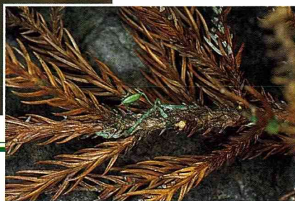
■小蜘蛛蘭將她的綠臂膀盤住柳杉的刺刺的葉子，而綠色膨大的部份為其莢果。