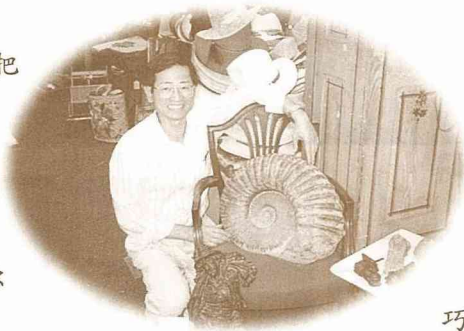
■這座菊石化石，直徑約1.8 公尺，重約23公斤。

在跳蚤市場裡，討價還價在所難免。殺價不只是為荷包著想，事實上也是逛跳蚤市場的樂趣之一。