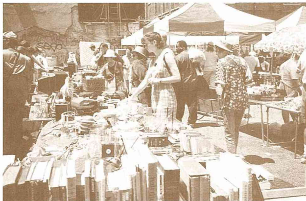
■販賣二手書籍與杯盤器皿的攤位，也許可以找到愛不釋手的絕版書。

GARAGE的隔壁是鵝兒喜（Chelsea），這是一棟12層樓的建築物，全都是古董文物商店。在一樓的入口處有一張樓層介紹單，將商