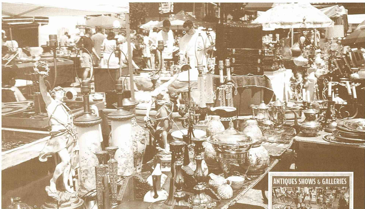
■跳蚤市場裡所販售的燈飾與台座，製作精美，洋味十足。

品的性質分門別類列出，顧客只要拿了這一張說明書即可一目瞭然。筆者先搭電梯上12樓，然後逐層逛下來。除了一般項目之外，這裡還有珠寶、瓷器、紡織品、燈具、玩具、稀有書本等等。