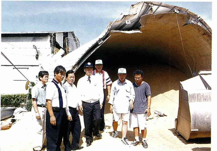
■彭主委與立委劉政鴻(左三)視察糧倉受損情形。這次有330座圓筒穀倉被震垮，受災稻穀10萬6千餘公噸已全數搶救處理完成。

閒旅遊之多元化功能，並配合城鄉新風貌工作，進行整體規劃，最重要的是要加強居民參與，建立社區發展共識。