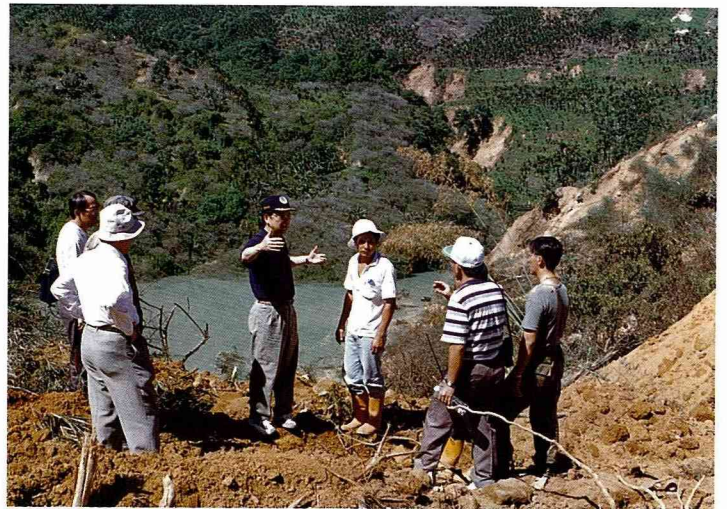
■彭主委率同學專家勘察九份二山堰塞湖，目前溢洪道工程已經發包動工。