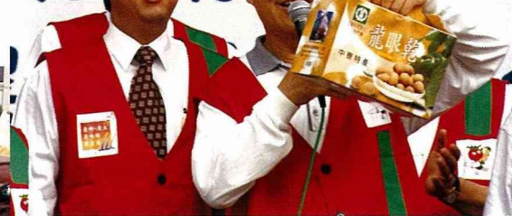
■行政院長蕭萬長在義賣會場促銷中寮鄉特產龍眼乾。