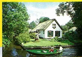
■羊角村的水路社區一景。

荷蘭人的圍堤、造陸與運河風光在休閒產業上是與荷蘭的風車、鬱金香、乳酪同樣的重要，明年夏天我們將帶領鄉間小路的讀者拜訪大畫家梵谷的故鄉，去體驗這個位在海平面6公尺下的低地國農業。