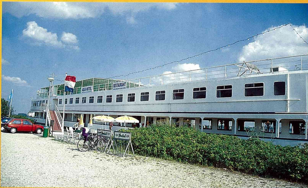
■ 造路工人住屋改建的民宿。