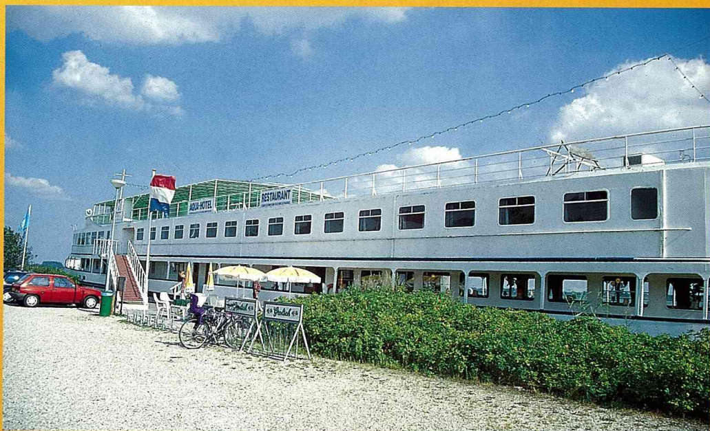
■ 造路工人住屋改建的民宿。