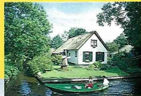
■羊角村的水路社區一景。