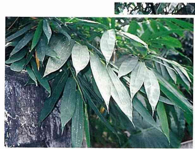
■竹葉除了包粽子，裹上竹葉烤魚烤肉，味道更佳。