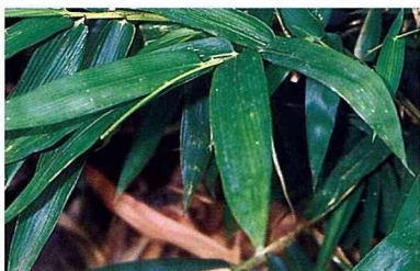
■竹心葉茶，只採取竹心葉。

爲了確保竹筍鮮嫩的品質，天未亮就得到筍園開始採筍的工作，趕緊送到市場販賣，求個好價錢。竹筍很容易木質化，放置過久，呈老化現象，且煮後常帶有澀味，已往在離產地遠的地方，不容易吃到鮮筍。