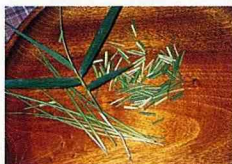
■將竹心葉曬乾備用。