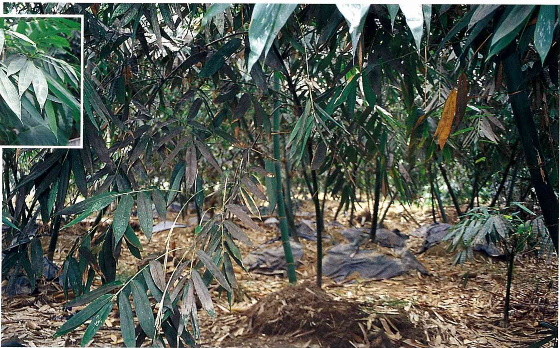
■竹園裡看見竹筍了嗎？