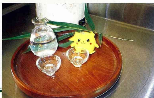
■沖泡出來的竹心葉茶，色澤清淡，有清香。