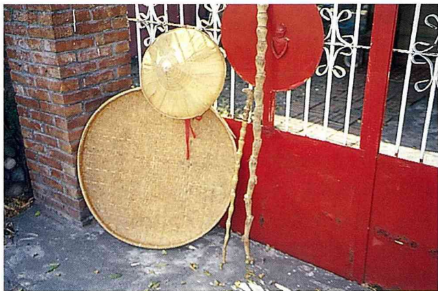
■竹的用途廣，這二根手杖是家父家母早晨散步的良伴。

現在有些產地不斷地改良生產方法，提升品質，在包裝與輸送的過程也力行進步。像竹筍採用預冷於2-4℃，再行包裝。先是清洗選擇好筍，移入4℃水槽中，預冷1-2小時，再行包裝之後送入冷藏庫，然後分送到市場。不用任何防腐劑或保鮮劑，就能達到保鮮的效果。這樣的產品消費者喜