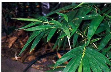
■我家門口種了幾株葫蘆竹。

中國人愛竹，也善用竹。竹筍一直是台灣的外銷農產品之一，廣受世人歡迎。一般來說，常供食用的竹類有麻竹、綠竹、烏腳綠竹、孟宗竹、桂竹。種植面積廣闊，本省南北均有出產，但以中部為盛產地。新鮮竹筍供應內銷，加工品大量外銷。在台灣除了冬季因為只有孟宗竹少量發筍，稱為冬筍，價格比較貴之外，一年四季都可以買到物廉價美的竹筍；這也是一種幸福，您同意嗎？