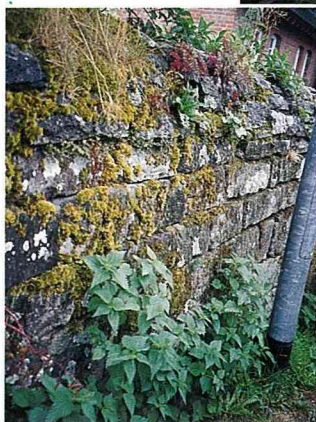
■ 數一數，這一面圍牆上有多少植物群落？