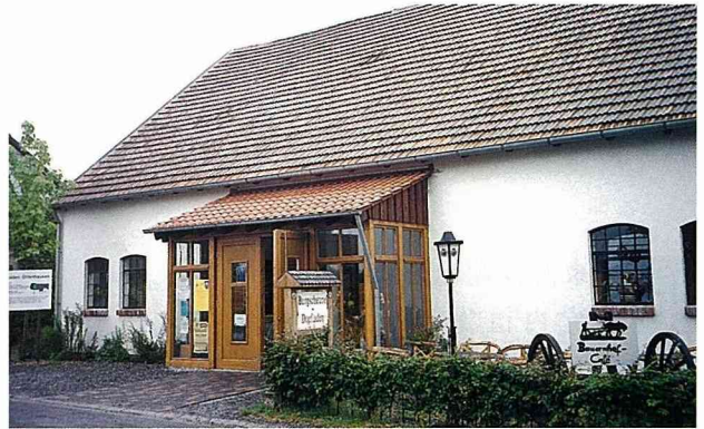
■ 穀倉改建的餐廳與迷你超市，為寧靜的農村帶來一點經濟活力。