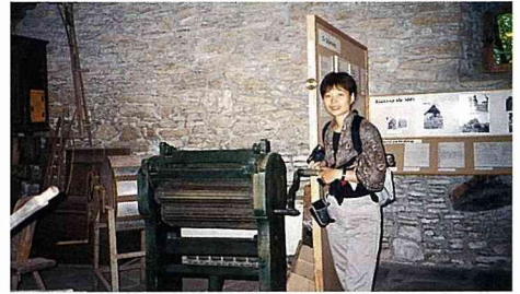
■ 餐廳二樓放置農村文物，圖中為早期的手動印刷機。