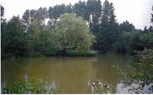
■ 低地池塘儲留的雨水，在乾旱期發揮很大的作用。