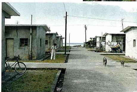
■ 現代化的蘭嶼社區，是否被水泥包封得喘不過氣來了？

鄉村道路旁的空地，也提供兒童嬉戲玩耍的空間。對現代人而言，鄉村道路還可以發揮運動休閒的功能，如騎馬、騎腳踏車等。