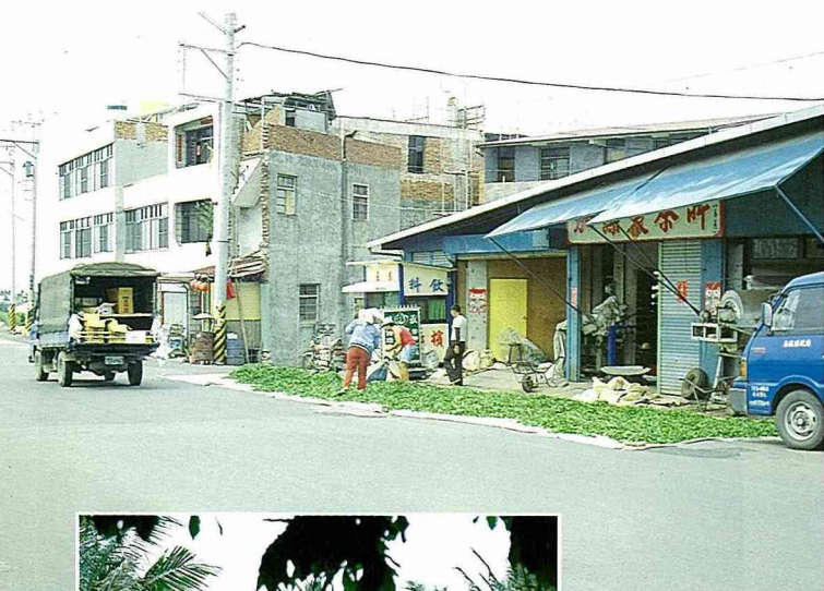
■路旁晒茶菁，是傳統茶鄉早年的熟悉場景。