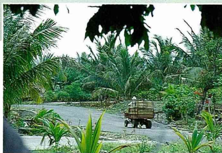
■產業道路充分發揮運輸的功能。