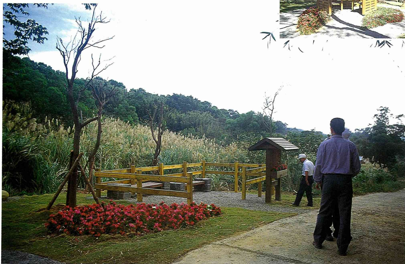
■農村社區道路旁增設涼亭、座椅等休憩設施之後，道路很快就人氣活絡起來。