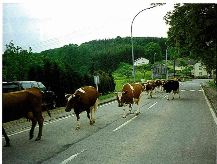
■在台灣農村，這種牛群與人共用馬路的悠閒畫面，恐怕已經消失無蹤了。