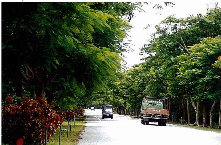
■其實在台灣，我們就有符合生態標準的鄉村道路，馬路兩旁綠蔭夾道，路邊有土溝、有灌木叢，如此美麗的道路景觀，也許很快就被道路拓寬工程給毀掉了！

其實鄉村道路更常見雞鴨、貓狗散步其上，今天急駛而過的汽車，讓這種動物與人共用馬路的悠閒畫面，消失無蹤；今天的小小羊兒要回家，已經無法取道馬路而歸，因爲路早已不是牠們可以放心走的了！