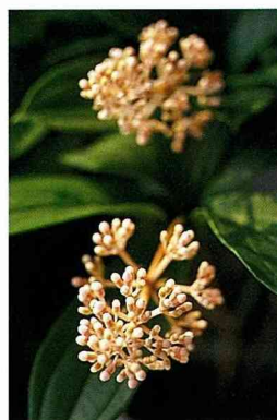
■野牡丹藤美如珍珠的花序。

4. 肉穗野牡丹及東方肉穗野牡丹是草本植物，因族群在台灣地理分佈的不同，葉形、葉色均有很大的差異，花色艷麗，耐陰性極佳，可作為陰濕地表，室內小品盆栽花卉利用。