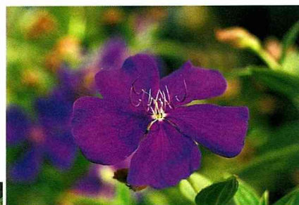
■花色艷麗的豔紫牡丹

4. 肉穗野牡丹及東方肉穗野牡丹是草本植物，因族群在台灣地理分佈的不同，葉形、葉色均有很大的差異，花色艷麗，耐陰性極佳，可作為陰濕地表，室內小品盆栽花卉利用。