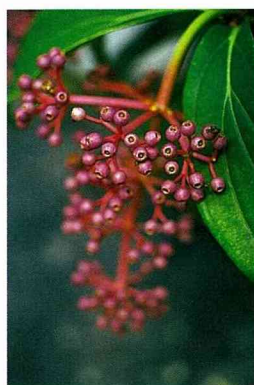
■野牡丹藤成串的小紅果，喜氣洋洋。

3. 鋪葉野牡丹的葉背披滿褐色毛茸，葉片大，樹形優美，花朵顏色特殊為其最大特色，是大型盆栽，小型行道樹，綠地之景觀賞樹的最好材料。