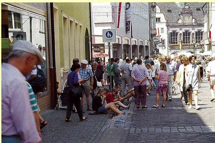
■ 芙萊堡城中的中古水路系統，今天變成了孩童與觀光客的最愛。