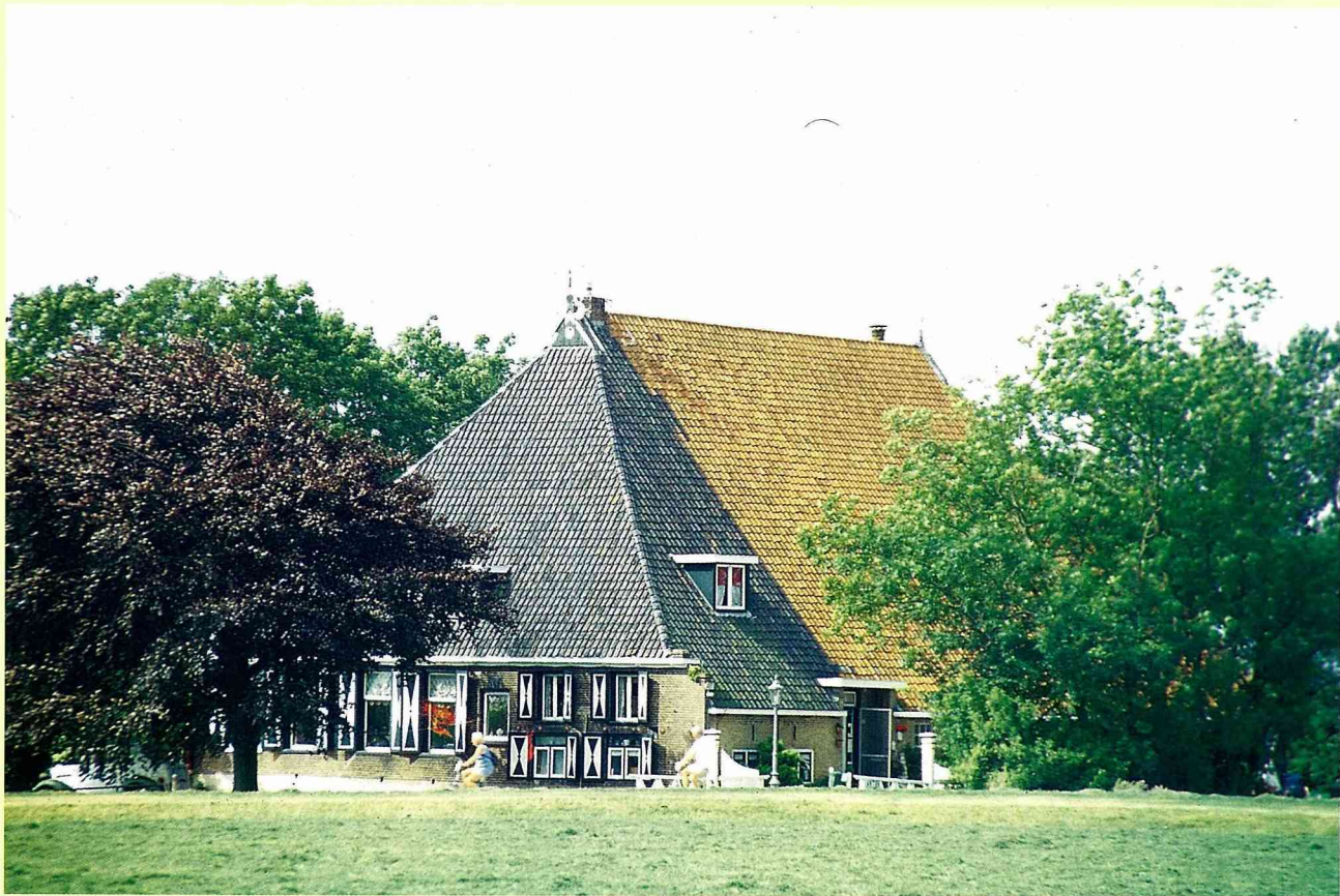
■ 荷蘭古農舍：紅色屋頂—牛棚；黑色屋頂—住宅。