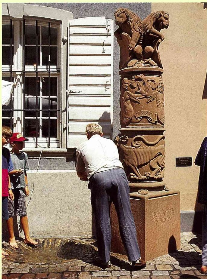
■ 路旁的水泉，供人們洗手洗腳。