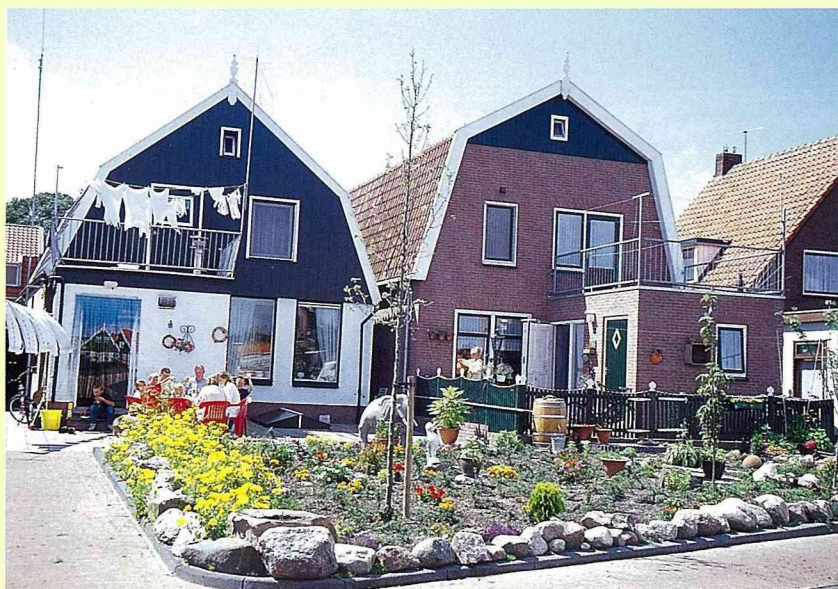
■ 荷蘭人在屋前屋後種花種菜，曲折式的屋頂是荷蘭建築特有的風味。

過的，每根茅草長度直徑一致，然後經過良好的防腐、防火等處理，再用到屋頂上。這種茅草材料因透氣性佳，隔熱抗寒效果好，用在屋頂上既有節能作用，又讓人住得舒適，早期茅草不耐用的因素，已因工業處理技術的進步，而增加了茅草的耐久性與抗燃性。故這種看似傳統的屋頂，其實其中蘊藏了許多先進的技術與知識，茅草屋頂的造價要比一般的覆瓦屋頂，造價貴上好幾倍呢！