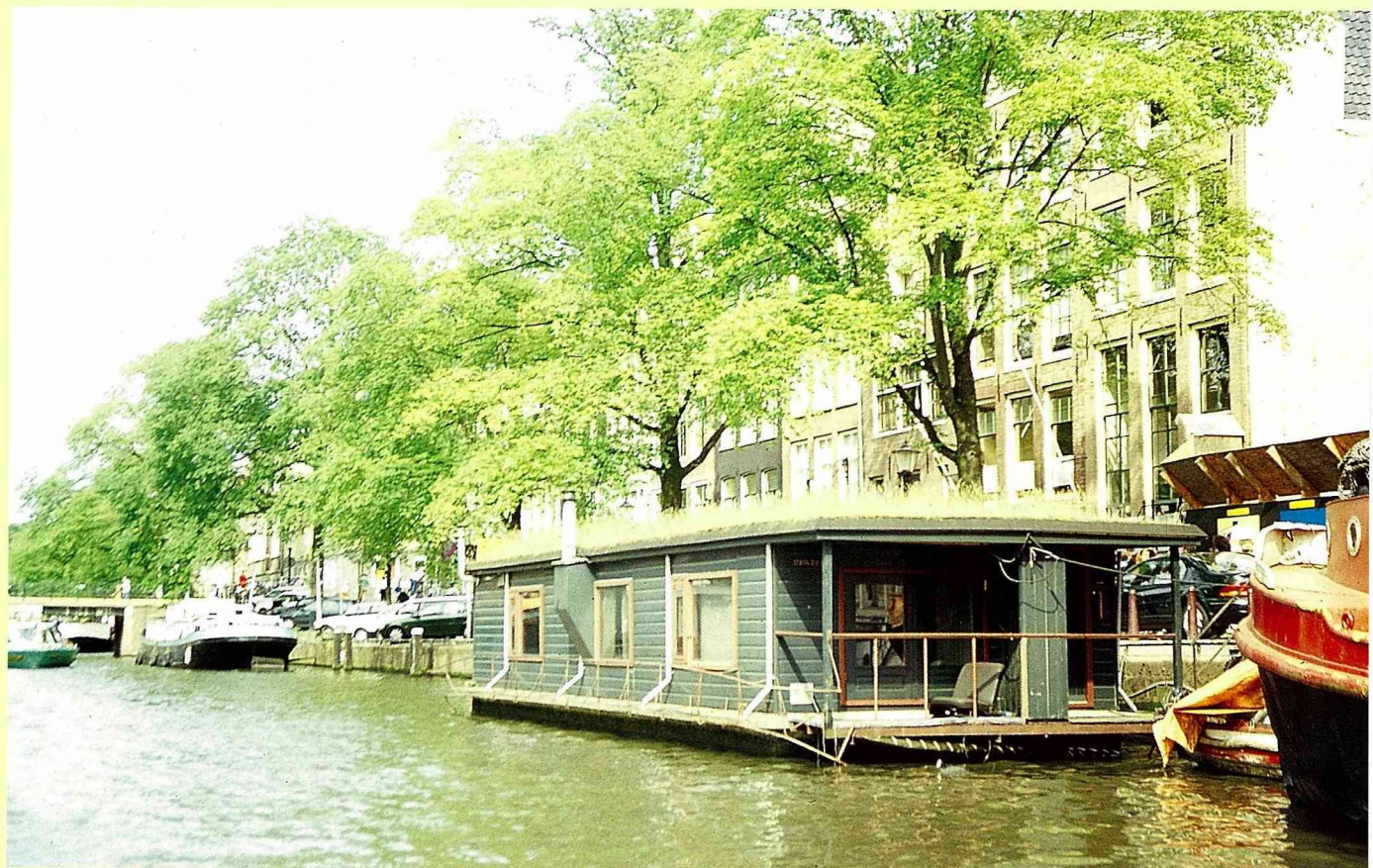
■阿姆斯特丹市運河中的船屋。