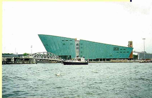
■阿姆斯特丹的水邊博物館。

路旁的水泉與水景也讓遊人們玩得不亦樂乎，這種保存水文化的建設觀念，不僅讓芙來堡的居民能慎終追遠，也能藉此發展觀光休閒，賺觀光客的錢；更重要的是這些水道今天仍在發揮著功能，提供觀光人潮洗手與洗腳，所謂靠山吃山、靠水吃水，芙來堡的居民當之無愧。