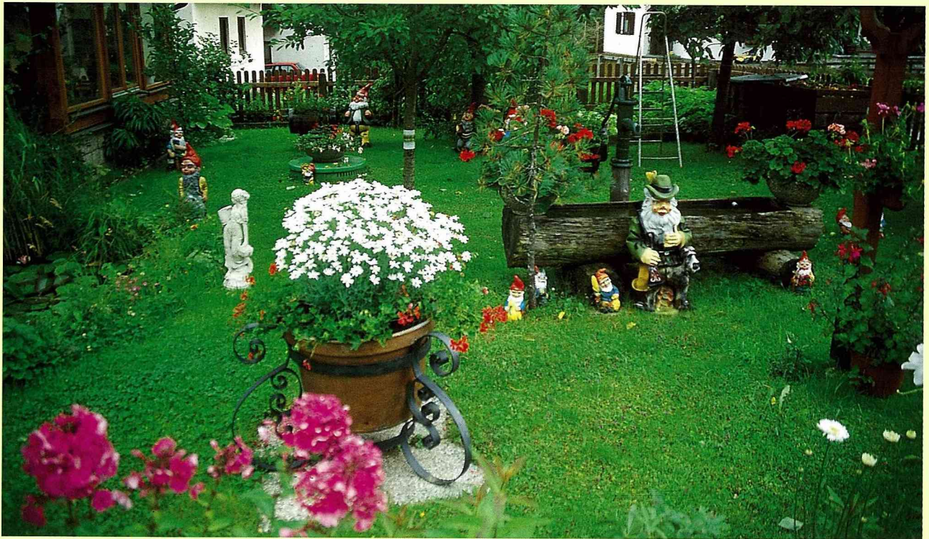
■白雪公主與小矮人的庭院佈景。

真是荷蘭人夏天的最愛。河水中柔美的建築倒影、路旁的綠樹與點點船影，搭配著不同造型且用色大膽的小鋼橋，與藍天輝映，在水中形成了一幅只有在荷蘭才見得到的街景。