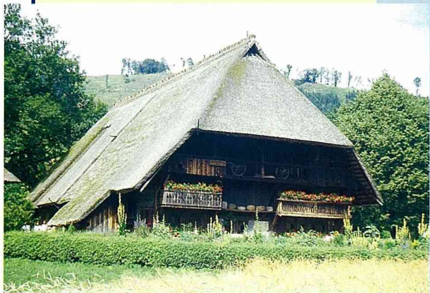
■德國黑森林中的古農舍，人畜共居。