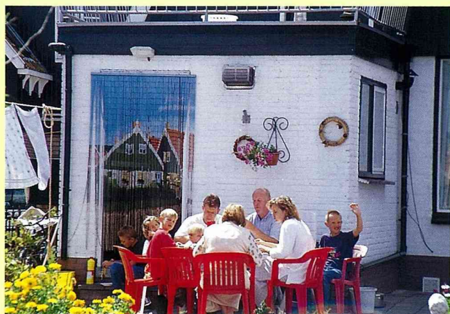
■坐在庭院中與家人共進晚餐。

卻可以提供上層居住的人使用，但在這種建築空間分配方式下，牛隻的氣味常影響著人居空間的品質，荷蘭人這種人畜分居的建法，是要較德國的農舍衛生且容易維持乾淨。