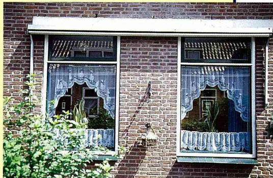
■荷蘭人喜歡打開窗簾，秀給路人看。