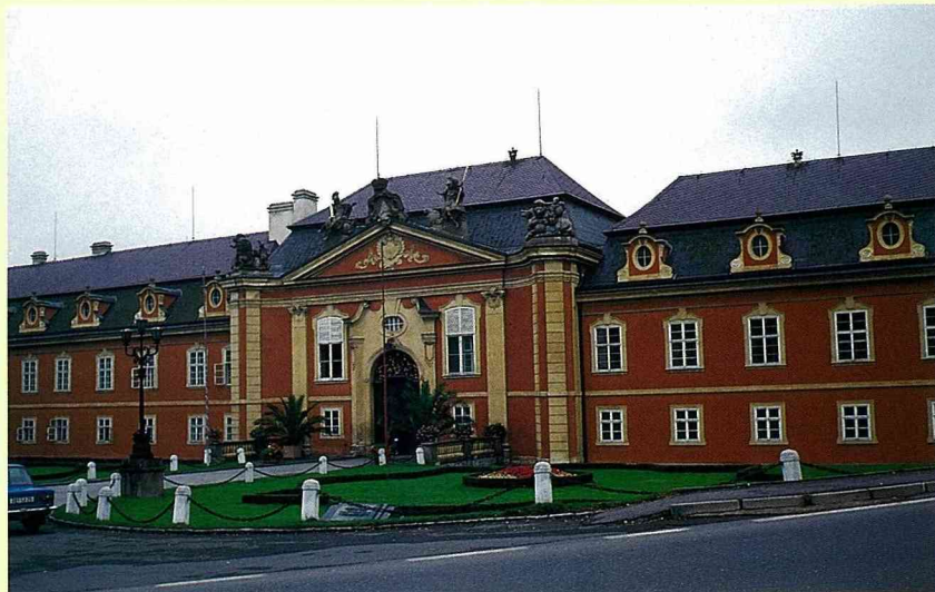
■專供畫家、哲學家創作的捷克皇宮。

運河、植栽、花卉加上休閒設施如搖椅、遊戲設備、太陽傘與點景等也常見於庭院中，讓人十分欽羨荷蘭人的戶外生活品質。滿地的綠意，配上了這麼多有趣