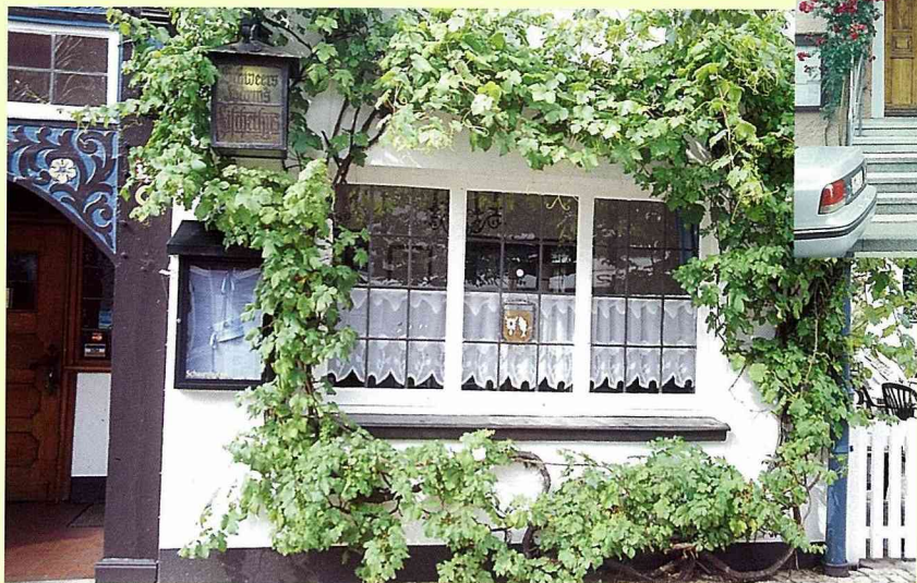
■綠色植物做窗戶的框景。

記得有一年深秋，到荷蘭鄉間旅行，入夜之後，只有我一個人還在找路，但見兩旁荷蘭住家燈火通明，讓人打從心底燃起一股暖流，一點也不覺得孤寂與寒意，這不得不佩服荷蘭人在建築設計上的巧思與落落大方。