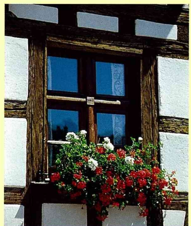
■美麗的窗台布置，最引人注目。

荷蘭首都阿姆斯特丹，以三大運河交織而成的浪漫街景而著名，陸地上有歐洲古城的歷史文化建築物，沿著運河而築的豪宅、餐廳、博物館與船屋等水上建築，河道中密佈的遊艇與觀光船，也替阿姆斯特丹解決了許多陸路擁擠的問題。