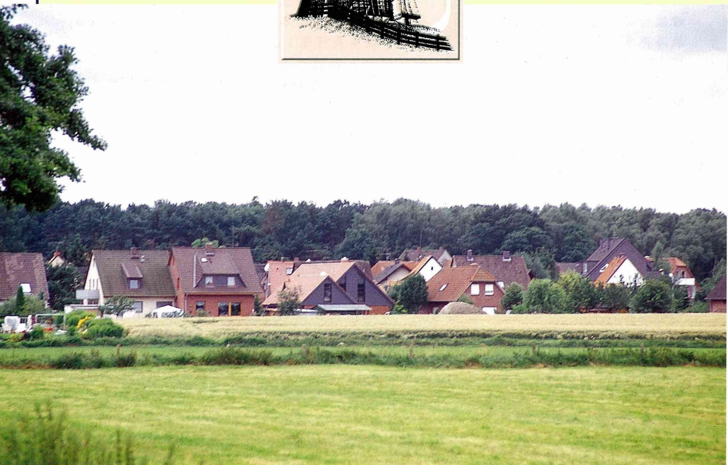
■樹群圍繞的海岸農村聚落。

荷 蘭人從小必須學會兩件事：騎單車和游泳。因為荷蘭是個低於海平面的國家，有引以為傲的自行車文化。荷蘭還有傑出的建築師，因為以治水與造鎮出名的荷蘭人，建築上也脫離不了水的影響，城市與鄉村中均可見到建築與水結合的完美演出。