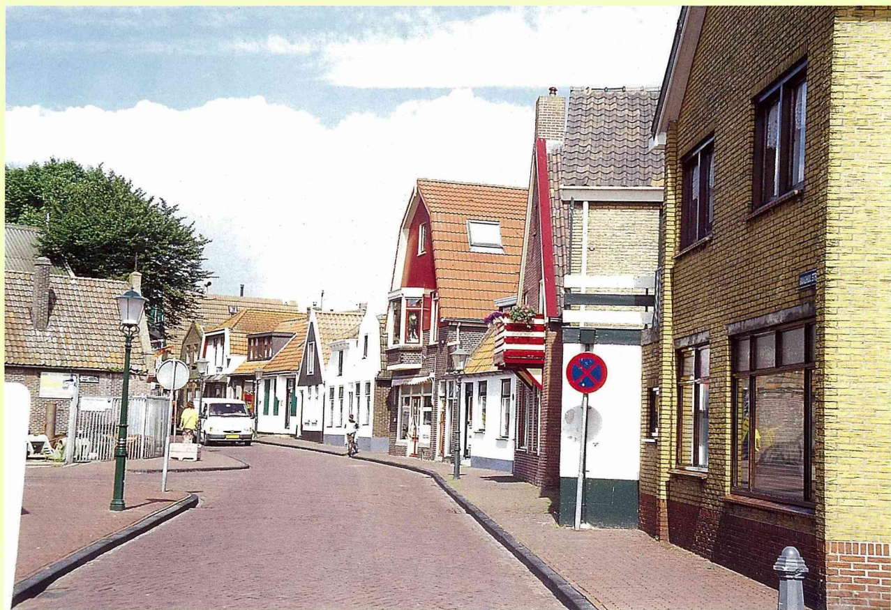
■毗鄰而建的老街建築物。