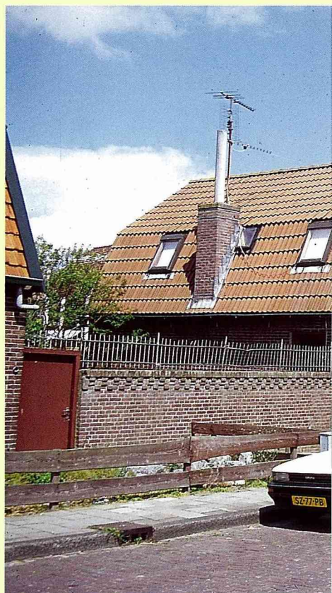
■每棟之間有走道相隔的新建街屋。

這些街廓建築一般不是全排正面朝街，就是山牆面朝街，等高的屋脊配上齊一的建築線，呈現一幅幅整齊的建築畫面；但每戶建築立面造型又均不相同，再搭配上不同的窗型、擺設與庭院空間，形成了一幅同中有異