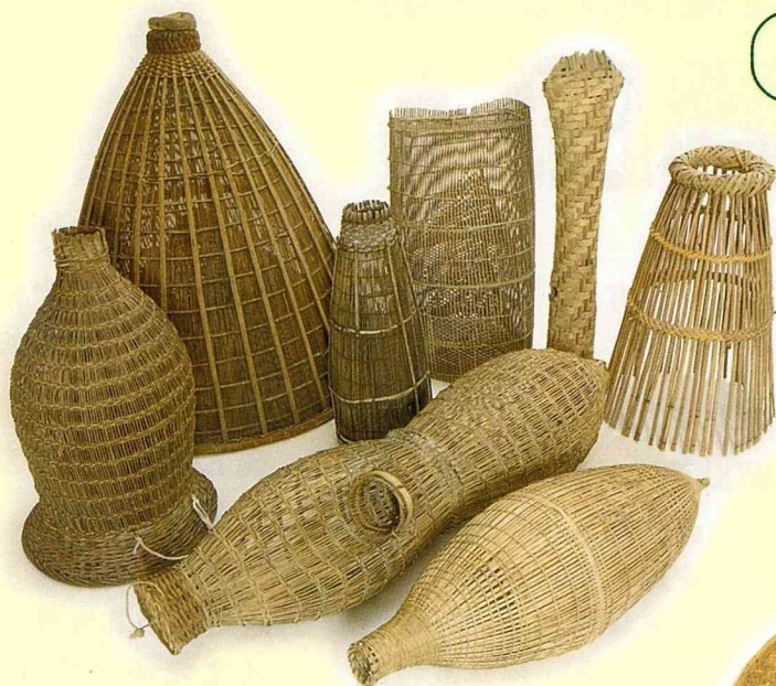
各種不同造型的魚筊 用來捕捉各類漁獲