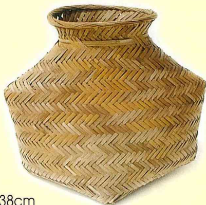
茶葉籃 52*51*38cm 人工採茶裝放茶菁之農具