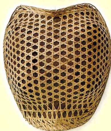
龜殼形披蓬 85*76*22cm 防日曬之農具