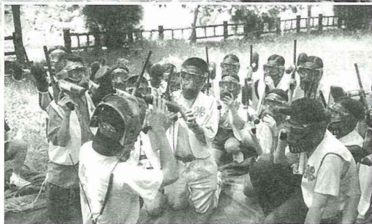
■四健戶外活動 —叢林偽裝。

在日常生活學習方面，安排了鄉內尋根之旅，參觀鄉內的養殖場，並且教導會員如何分辨魚類的新鮮度等，還得自己動手練習殺魚呢！