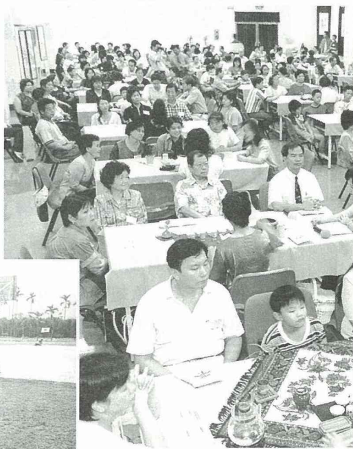
茶與音樂的饗宴，考驗你的味、聽覺。

四健會在農業推動工作中，主要的任務是負責農村教育整體的規劃，方向的擬定，並長期往下扎根，教育農村青年成為具有科學知識