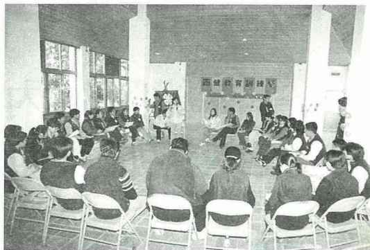
■鹿谷鄉大專青年召集回鄉培訓。