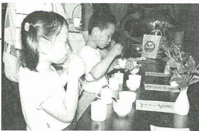
■配合鹿谷鄉特產舉辦的「趣味評茶」。

青年留在農村的意願，所以農村青年人口流動性可說是相當大的，只能從現有人力資源充分運用。