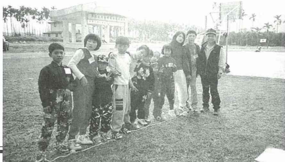
在瑞田國小舉辦「心靈重建四健生活體驗營」與幼級會員合影。