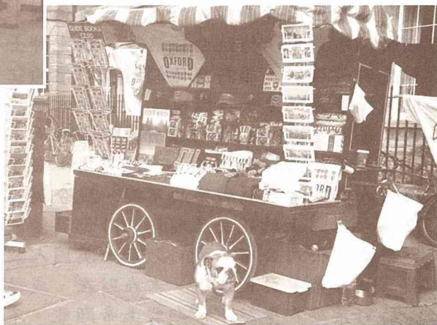
■英國牛津街頭紀念品小亭販售六合彩票。