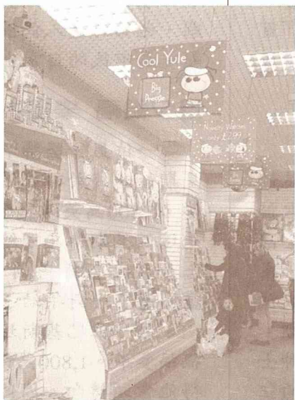
■英國卡片商店內也出售六合彩票。

六合彩票一券一英鎊，一鎊圓一個夢想。四十九個數字中，任你押上六位數，當然多買機會越多，每周三、六公開搖獎兩次。如果你事先圈定的六位號碼恰與所開的號碼全都吻合，那麼你便福星高照贏了頭等彩金，頃刻擁有了百萬英鎊的收入，若押中了五位數字就可得二等彩金，押