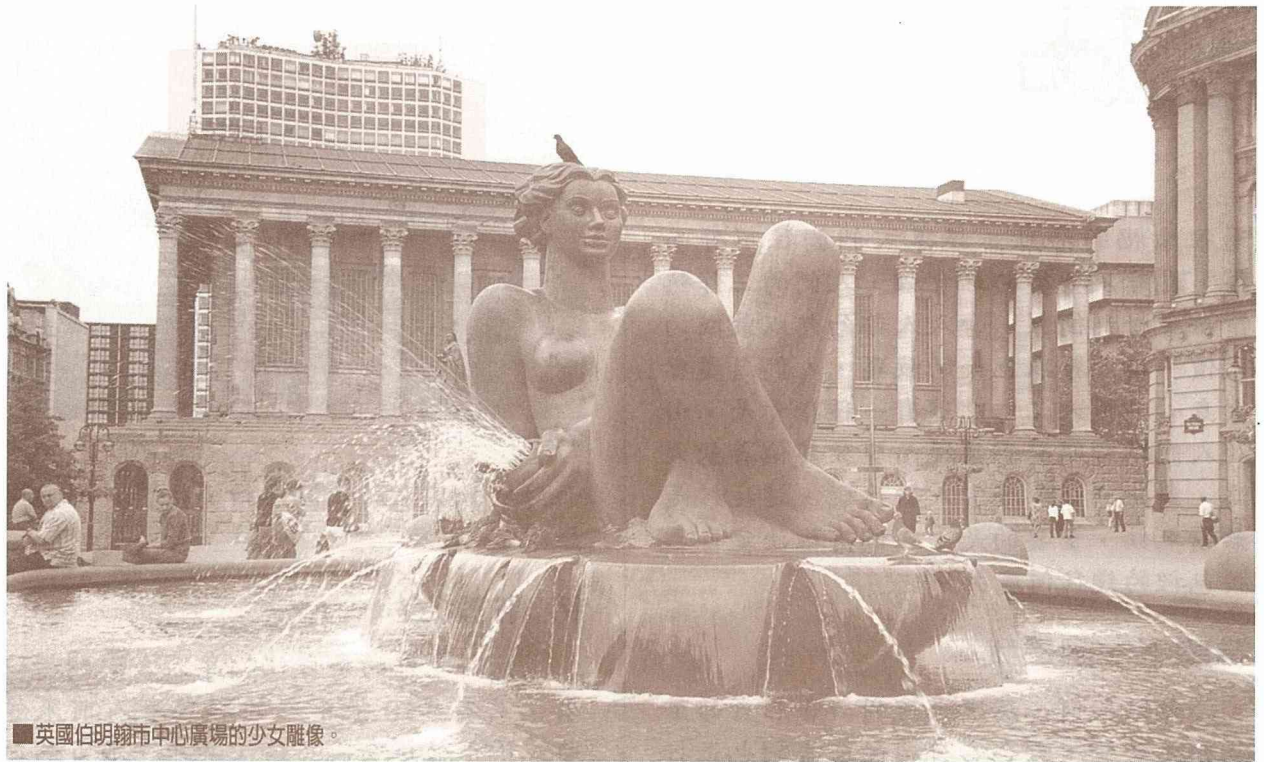
■英國伯明翰市中心廣場的少女雕像。

中四個號碼得三等獎，中三個號碼也可得到末等10英鎊的安慰獎。自六合彩開辦以來，1995年6月搖出了最大的一筆彩金2千3百萬鎊，而榮獲頭等獎者最“倒霉”的一次是1995年1月，因共有133人同時圈出了頭等獎號碼，以致於每人僅分得12萬英鎊的彩金，還不如二等獎彩金的數目高。當然也出現過多次連續兩周無人押中頭等獎的戲劇場面，致使最高彩金額累計高達上千萬英鎊，促使本已炙手的彩票熱上添熱。重賞之下必有勇夫，於是吸引更多的人投入更大的賭注，彩票立即創出銷售新紀錄。