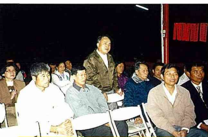
■ 澀水人關心澀水事，大地震讓澀水人更加心手相連。