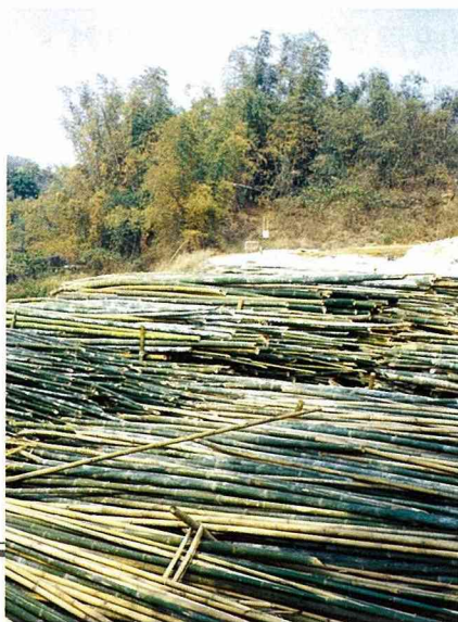
■關廟山多盛產竹材。