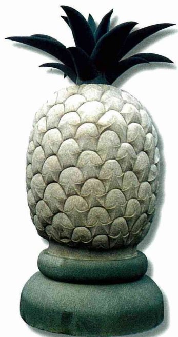
■大潭埤旺萊紀念公園的巨型鳳梨地標。