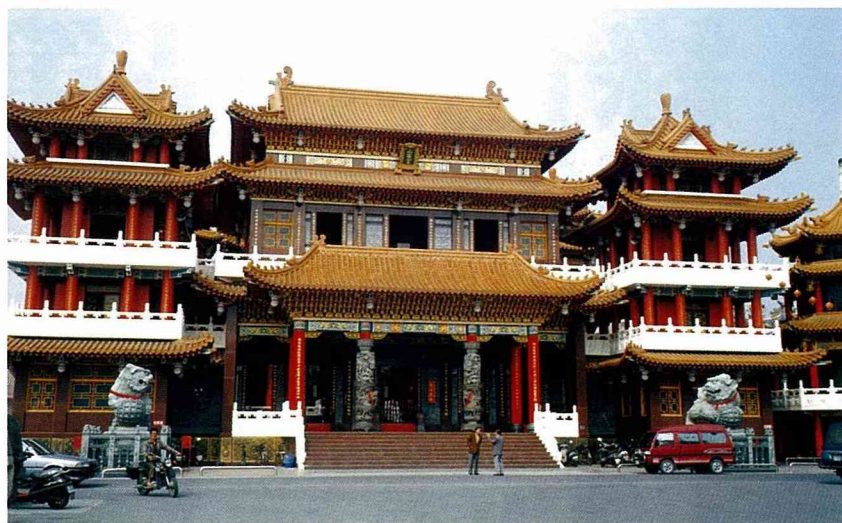
■關廟人精神信仰中心—山西宮。

關廟位於台南縣南側，嘉南平原南端，許縣溪上游，從台南市沿182縣道東行，經仁德、歸仁使可直達，或循南二高（三號國道），於關廟交流道下，亦可抵達。