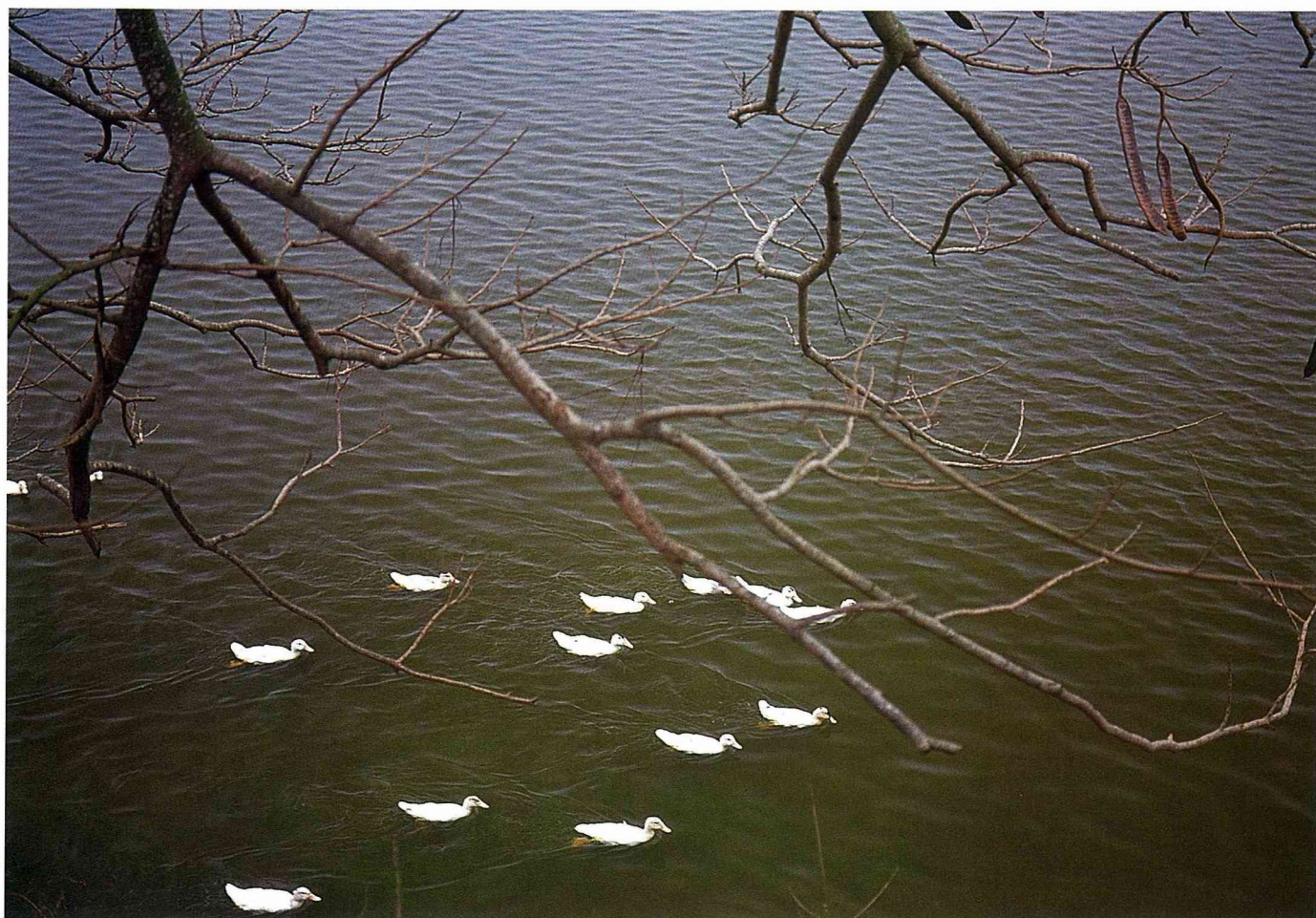
■風景優美的大潭埤。