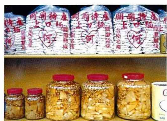
■關廟特產的「關廟麵」與「鳳梨醬」。

關廟鄉的製麵業有數十年經驗，在「鳳梨節」推出的鳳梨大餐有一道「炒關廟麵」，口感奇佳，大大出鋒頭，因而打開了知名度。街上有十來家製麵廠，包裝袋上除了印有「關廟麵」，還加印製麵者的姓氏，圈起來，作為產品區隔的標記。