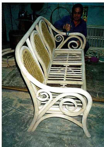
■關廟的藤器加工，也頗出名。

清嘉慶年間，因泉、漳械鬥，漳州人乃另闢一市街，因街上有一座山西堂供奉的關聖帝君廟，而將新闢的市街，命名為「關帝廟街」，原有舊街因處於廟後，故稱「廟後街」。台灣光復後，簡稱為「關廟」。