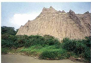
■青花岩是內門地質特色。