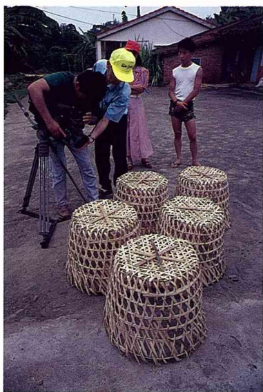
■內門竹篾成為電視節目的主角。