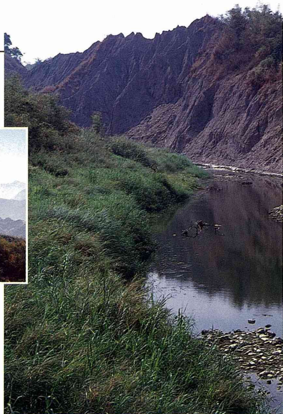
■二仁溪發源於內門。

內門鄉四面環山，中間形成一個盆地，二仁溪上游貫穿盆地中間。清代初年，先民初履此地墾荒，目睹四周群峰羅列，二仁溪河道的出口是唯一的缺口，在鄉境的西南端，內東、瑞山二村的交界處，此地溪岸兩側皆